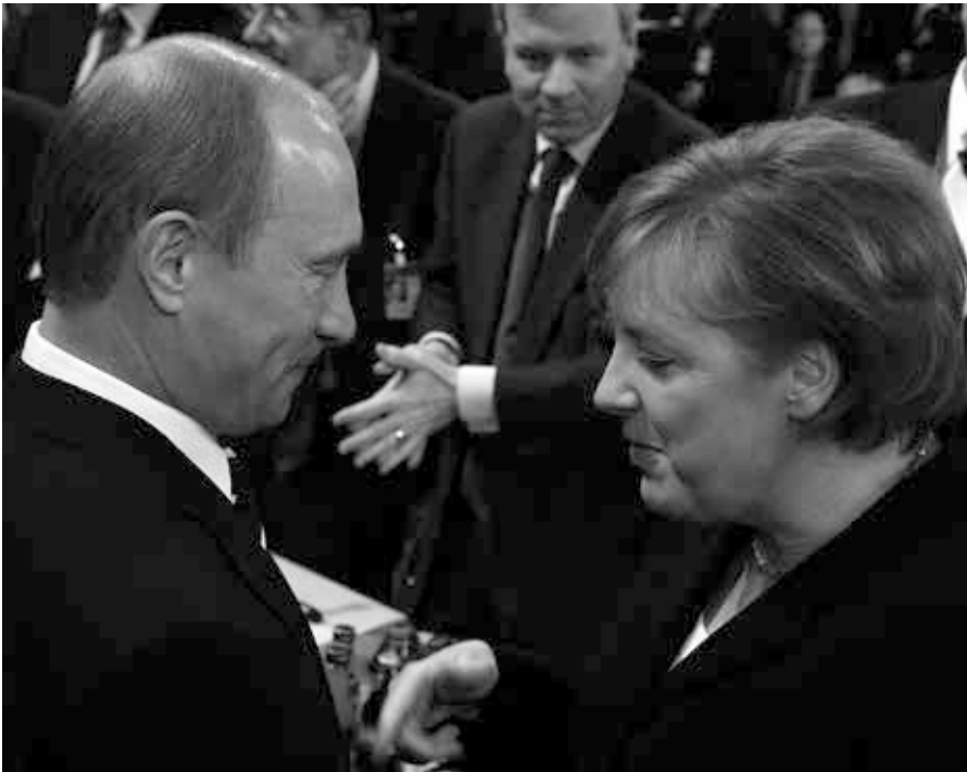
43. Münchner Sicherheitskonferenz: Der Präsident der Russischen Föderation, Wladimir W. Putin und Bundeskanzlerin Dr. Angela Merkel während der Konferenz, 10.2.2007.

Knapp fünfeinhalb Jahre später hielt Putin im Münchner Hotel „Bayerischer Hof“ eine Rede, die im westlichen Narrativ als „Brandrede“, gar als „Beginn eines neuen Kalten Krieges“ eingehen sollte.