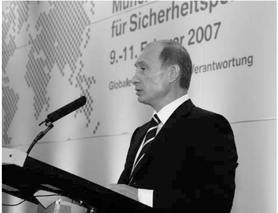
43. Münchner Sicherheitskonferenz: Der Präsident der Russischen Föderation, Wladimir W. Putin während seiner Rede 10.2.2007.