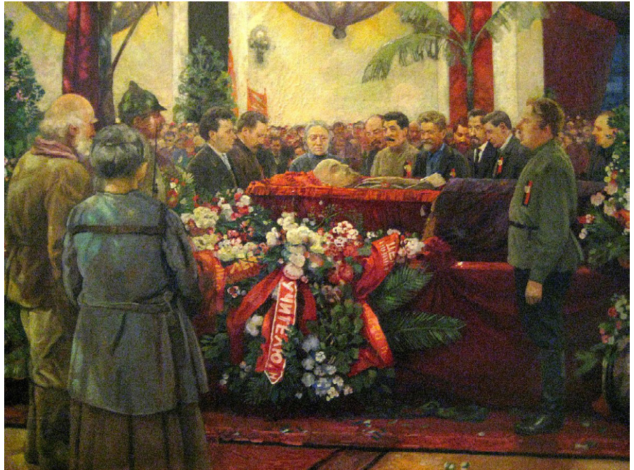
Öl-Gemälde von Isaak Brodsky mit dem Titel: Lenin's Beerdigung.

Während früher die europäischen Großmächte sich die Rosinen anderer Kontinente ungestört herauspicken konnten, sind die kolonialen Claims zu Lebzeiten Lenins bereits vollständig abgesteckt. Wer jetzt noch kolonialen Besitz erwerben will, kann das nur noch auf Kosten anderer Kolonialmächte tun. Das heißt also, kriegerische Raubzüge. Lenin ist redlich genug zu markieren, was er von dem deutschen sozialdemokratischen Theoretiker Rudolf Hilferding übernommen hat, und wo er selber weitergedacht hat. Lenins Theorie über den modernen Imperialismus ist bis auf den heutigen Tag gültig.