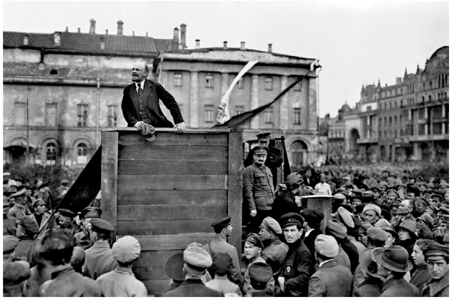
Rede Lenins, im Mai 1920 in Moskau.

Dieser Text wurde zuerst am 20.01.2024 auf www.manova.news unter der URL https://www.manova.news/artikel/der-gescheiterte-utopist veröffentlicht. Lizenz: Hermann Ploppa, Manova, CC BY-NC-ND 4.0