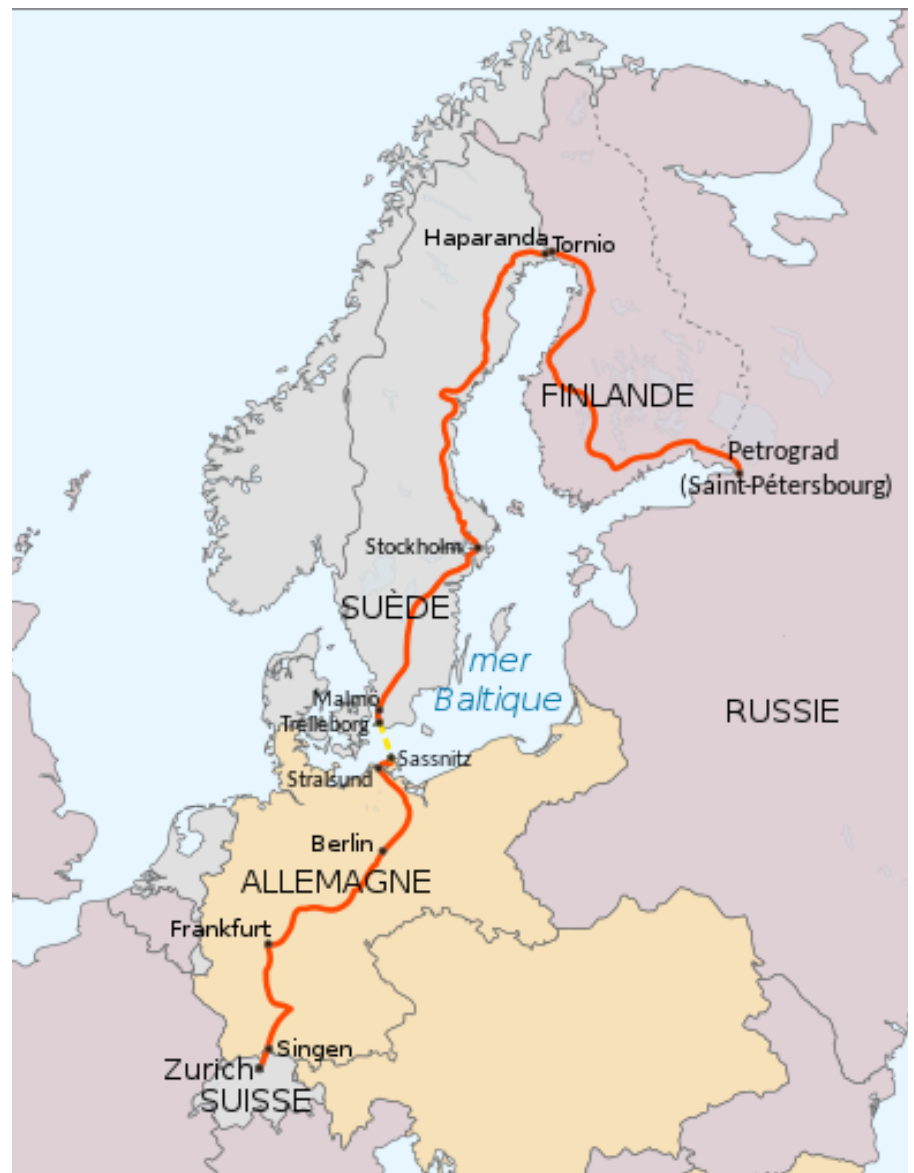
Lenins Reiseroute 1917 von Zürich nach Petrograd (heute: St. Petersburg) in einem verplombten Zug. (Karte: Kimdime / Wikimedia Commons / CC BY-SA 4.0 DEED)

talistischen Staates zu prüfen, gibt es kein anderes Mittel und kann es kein anderes Mittel geben als den Krieg. Der Krieg steht in keinem Widerspruch zu den Grundlagen des Privateigentums, er stellt vielmehr eine direkte und unvermeidliche Entwicklung dieser Grundlagen dar. Unter dem Kapitalismus ist ein gleichmäßiges Wachstum in der ökonomischen Entwicklung einzelner Wirtschaften und einzelner Staaten unmöglich. Unter dem Kapitalismus gibt es keine anderen Mittel, das gestörte Gleichgewicht von Zeit zu Zeit wieder herzustellen, als Krisen in der Industrie und Kriege in der Politik.“ [7]