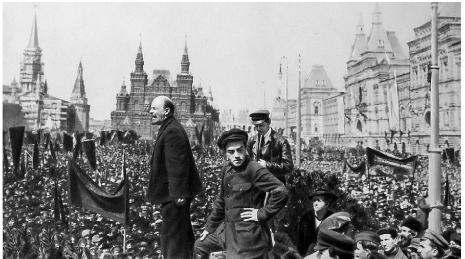
Wladimir Lenin hält eine Rede auf dem Roten Platz anlässlich der Einweihung eines provisorischen Denkmals für Stepan Rasin. 1919, 1. Mai. Moskau.

Ein Machtfaktor in Deutschland, an dem sich selbst der langjährige Alleinherrscher Otto von Bismarck die Zähne ausgebissen hatte und deswegen vom jungen Kaiser Wilhelm II. in die brandenburgische Wüste gejagt wurde [1].