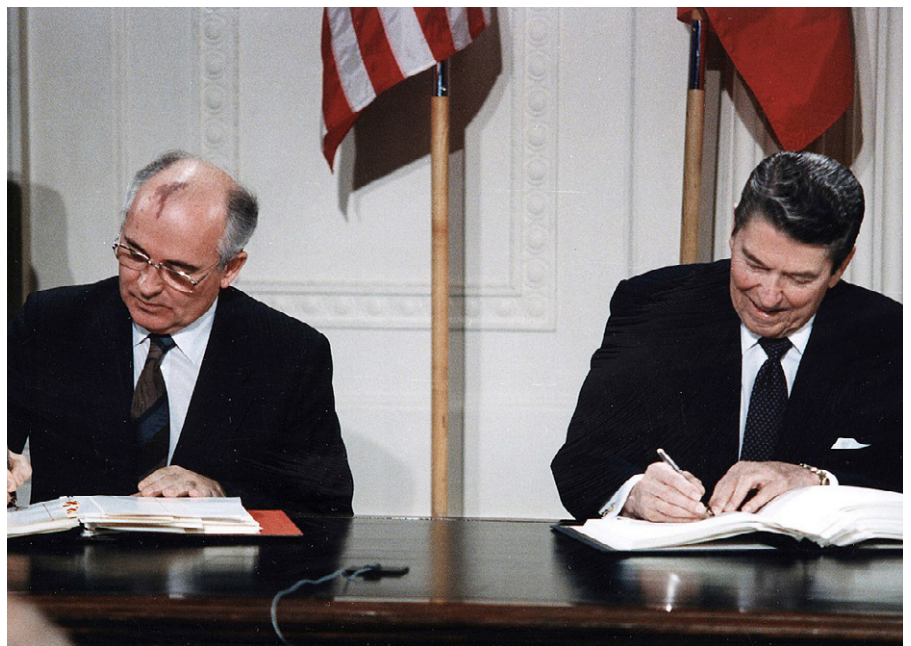
US-Präsident Reagan (rechts) und der sowjetische Generalsekretär Gorbatschow (links) unterzeichnen den INF-Vertrag im Weißen Haus, 8. Dezember 1987.

Auf die Frage, wann der zweite Kalte Krieg, wann das neue Wettrüsten denn begonnen habe, antwortete Putin: „Mit der amerikanischen Kündigung des ABM-Vertrags!“