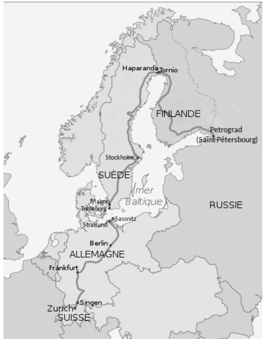
Lenins Reiseroute 1917 von Zürich nach Petrograd (heute: St. Petersburg) in einem verplombten Zug. (Karte: Kimdime / Wikimedia Commons / CC BY-SA 4.0 DEED)

talistischen Staates zu prüfen, gibt es kein anderes Mittel und kann es kein anderes Mittel geben als den Krieg. Der Krieg steht in keinem Widerspruch zu den Grundlagen des Privateigentums, er stellt vielmehr eine direkte und unvermeidliche Entwicklung dieser Grundlagen dar. Unter dem Kapitalismus ist ein gleichmäßiges Wachstum in der ökonomischen Entwicklung einzelner Wirtschaften und einzelner Staaten unmöglich. Unter dem Kapitalismus gibt es keine anderen Mittel, das gestörte Gleichgewicht von Zeit zu Zeit wieder herzustellen, als Krisen in der Industrie und Kriege in der Politik.“ [7]