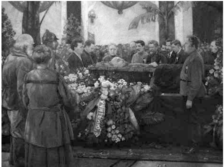
Öl-Gemälde von Isaak Brodsky mit dem Titel: Lenin's Beerdigung.

Während früher die europäischen Großmächte sich die Rosinen anderer Kontinente ungestört herauspicken konnten, sind die kolonialen Claims zu Lebzeiten Lenins bereits vollständig abgesteckt. Wer jetzt noch kolonialen Besitz erwerben will, kann das nur noch auf Kosten anderer Kolonialmächte tun. Das heißt also, kriegerische Raubzüge. Lenin ist redlich genug zu markieren, was er von dem deutschen sozialdemokratischen Theoretiker Rudolf Hilferding übernommen hat, und wo er selber weitergedacht hat. Lenins Theorie über den modernen Imperialismus ist bis auf den heutigen Tag gültig.