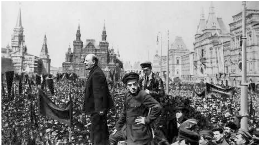
Wladimir Lenin hält eine Rede auf dem Roten Platz anlässlich der Einweihung eines provisorischen Denkmals für Stepan Rasin. 1919, 1. Mai. Moskau.

Ein Machtfaktor in Deutschland, an dem sich selbst der langjährige Alleinherrscher Otto von Bismarck die Zähne ausgebissen hatte und deswegen vom jungen Kaiser Wilhelm II. in die brandenburgische Wüste gejagt wurde [1].