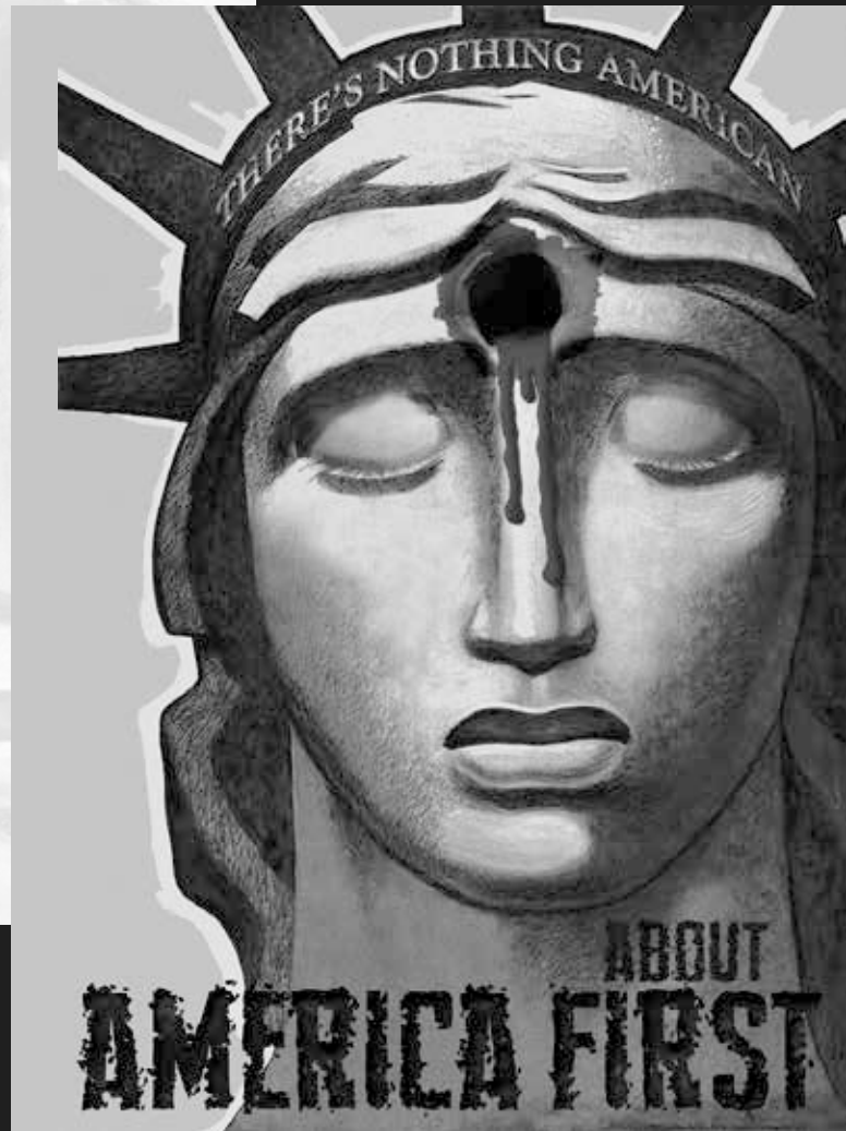
Symbolbild