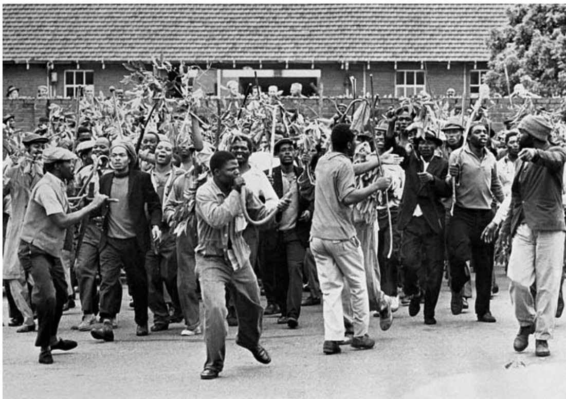
Streikende marschieren durch die Stadt, Durban, Südafrika.

Hemson hat das zeitgenössische Publikum daran erinnert, dass Turner einen grundlegenden politischen Fehler beging, als er sich mit der reaktionären, ethnisch konstituierten Organisation Inkatha ver-