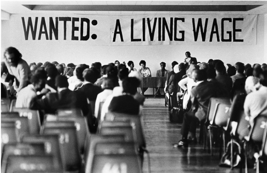
Streik Meeting 1973 in der Bolton Hall in Durban.