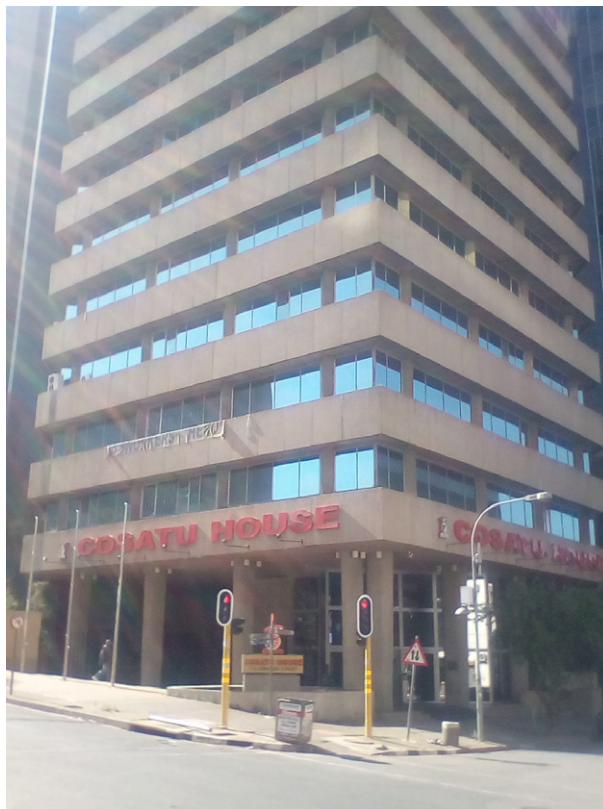
Das COSATU Haus ist das Hauptquartier des Gewerkschafts-Dachverbandes COSATU, die maßgeblich am Zusammenbruch des Apartheid-Regimes beteiligt waren.

Der Ausdruck der nationalen Tradition, die mit dem ANC verbunden war und nun in COSATU zum Ausdruck kam, war jedoch in wichtigen Aspekten durch den Durban-Moment geprägt worden, einschließlich der Ideen der Arbeiterkontrolle und des schwarzen Bewusstseins. Jay Naidoo, der erste Generalsekretär der