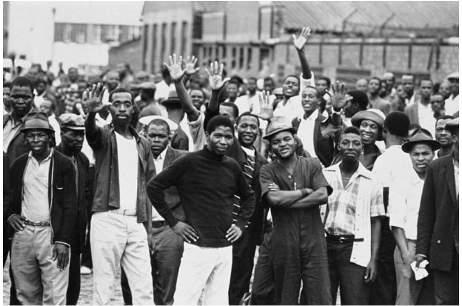
Streikende Arbeiter der Consolidated Textile Mill, Jacobs, fordern höhere Löhne.

Dieser Text wurde zuerst am 24.01.2023 auf www.thetricontinental.org unter der URL https://thetricontinental.org/dossier-1973-durban-strikes/ veröffentlicht. Lizenz: TriContinental und Chris Hani Institute, CC BY-NC-ND 4.0