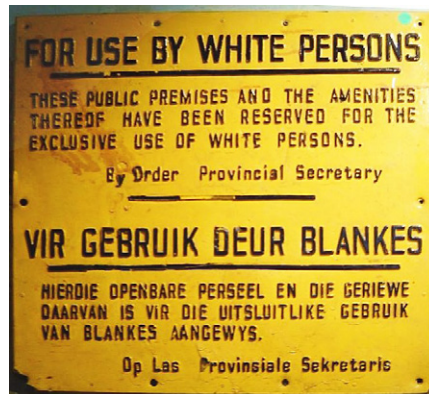
Die Rassentrennung des Apartheidregimes durchdrang alle Lebensbereiche.

Der SACTU war mit dem Afrikanischen Nationalkongress (ANC) verbündet und versuchte die gewerkschaftliche Organisation mit dem Kampf für die nationale Befreiung zu verbinden. Der Verband spielte eine führende Rolle bei der Welle landesweiter Streiks, die in den späten 1950er Jahren an Häufigkeit und Militanz zunahm. Dies war auch in Durban der Fall, das vor allem dank der Beharrlichkeit der Hafendarbeiter zu einem wichtigen Knotenpunkt der militanten Gewerkschaftsbewegung wurde.