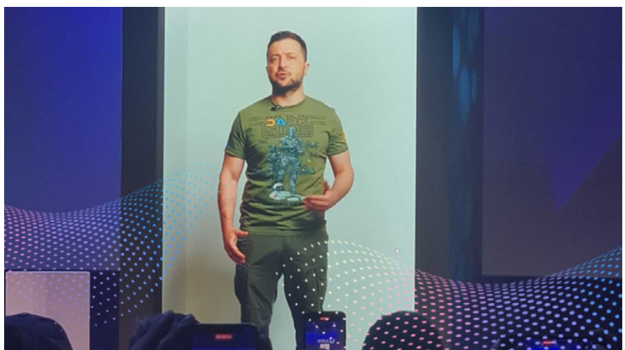
Volodymyr Selenskyj erscheint als Hologramm auf der Viva-Technologiekonferenz 2022. Seine Rede konzentrierte sich darauf, wie „die Ukraine Technologieunternehmen eine einzigartige Chance bietet, das Land als vollständig digitale Demokratie wieder aufzubauen“.