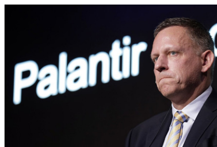
Palantir-Mitbegründer Peter Thiel

Obwohl Elon Musks Starlink vielen vom Konflikt betroffenen Ukrainern Internet zur Verfügung gestellt hat, wurde die Abdeckung teilweise aufgehoben [113], um zu verhindern, dass Starlink „für offensive Zwecke“ genutzt wird. Aber auch andere Unternehmen wie die Datenfirma und effektive CIA-Front „Palantir“, das Verteidigungsunternehmen „Anduril“ [114] und der Gesichtserkennungsdienst „Clearview AI“ [115] – Unternehmen, die vom frühen Facebook-Investor [116] und „Predictive Policing“-Enthusiasten [117] Peter Thiel finanziert bzw. im Fall von „Palantir“ mitbegründet [118] wurden – bringen die Vierte Industrielle Revolution in den Krieg. Während „Palantir“ der Ukraine bei der militärischen Ausrichtung von Kriegsmitteln wie Panzern und Artillerie hilft [119], werden neue Waffen und Technologien [120] wie die autonomen Altius 600M-Drohnen [121] des Verteidigungsunternehmens „Anduril“ auf dem Schlachtfeld eingesetzt. Außerdem setzt das ukrainische Verteidigungsministerium die Gesichtserkennungstechnologie von „Clearview AI“ ein [122], um „russische Angreifer zu enttarnen, Fehlinformationen zu bekämpfen und Tote zu identifizieren“. Da „Clearview AI“ weithin als invasiver Dienst angesehen wird, wurde der Verkauf seiner Dienste an die meisten Unternehmen und Organisationen in den USA (mit Ausnahme der US-Polizei [123]) untersagt [124]. Die ethischen Bedenken, die andernorts geäußert wurden, sind auf den ukrainischen Schlachtfeldern jedoch kaum von