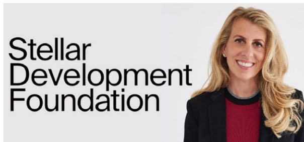
Denelle Dixon, Vorstandschefin von SDF.

ihr Potenzial als Instrument zur Korruptionsbekämpfung [70] und als integrative Möglichkeit, die „Unbanked“, d. h. diejenigen, die traditionelle Finanzdienstleistungen nicht nutzen oder keinen Zugang dazu haben, ins Bankensystem zu bringen. [71]