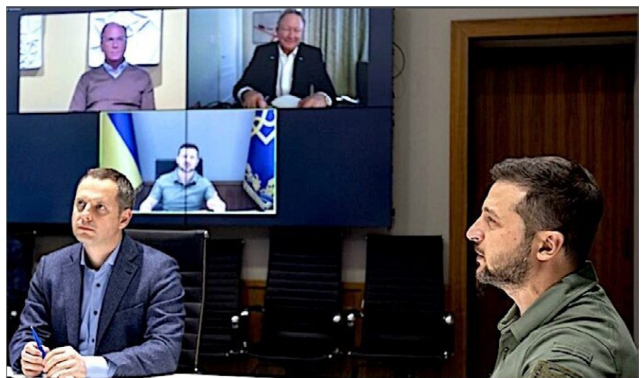
Volodymyr Selenskyj trifft sich Ende Dezember 2022 per Videokonferenz mit Larry Fink.

In der Zwischenzeit scheinen andere Großunternehmen bereit zu sein, einen Großteil der kritischen staatlichen Infrastruktur der Ukraine zu übernehmen, zumindest vorübergehend. Microsoft stellt der Ukraine in den Jahren 2022 und 2023 nicht nur Hunderte von Millionen US-Dollar zur Verfügung [97], sondern spei-