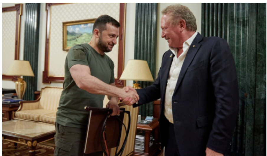
Wolodymyr Selenskyj (L) schüttelt die Hand des australischen Bergbaumagnaten Andrew Forrest (R) im November 2022.