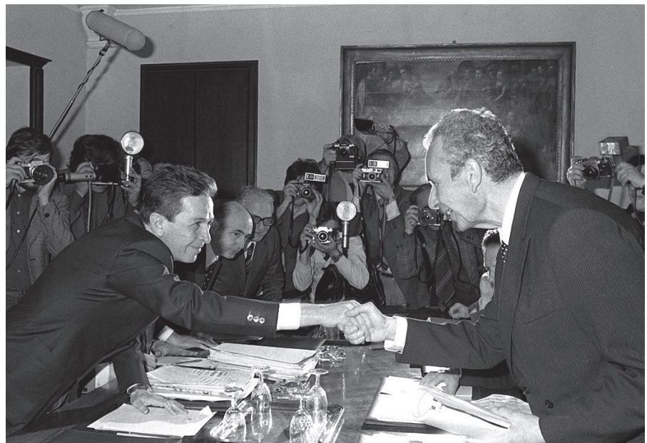
Rom, 3. Mai 1977. Von links: Händedruck zwischen dem Generalsekretär der Kommunistischen Partei Italiens (PCI), Enrico Berlinguer, und dem Präsidenten der Christdemokraten, Aldo Moro, den Hauptbegründern des sogenannten historischen Kompromisses.

Nur wenige Vertreter des politischen und diplomatischen Establishments der USA verkörperten die Feindseligkeit ge-