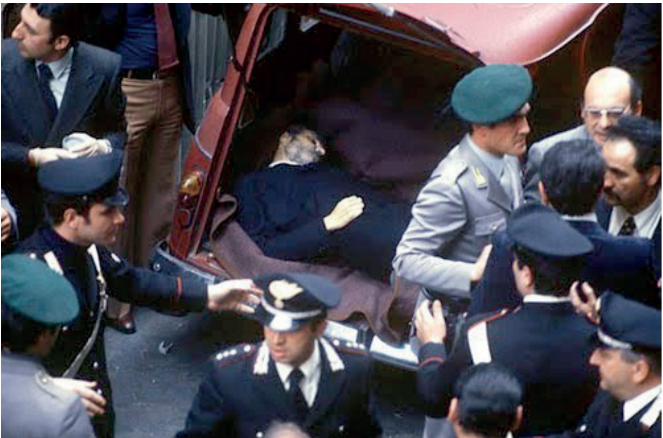
Aldo Moros Leiche wird am 09.05.1978 in einem roten Renault gefunden.

Offensichtlich war sich die Kommission des äußerst sensiblen Charakters dieser Erkenntnisse bewusst und sah sich bereits einem unglaublichen Druck ausgesetzt, als sie die Einstufung der gesamten