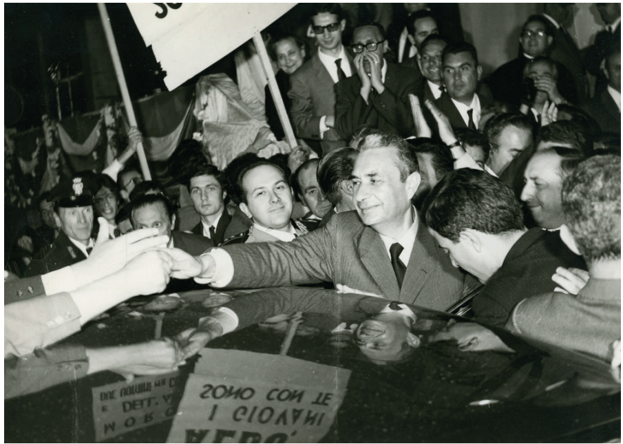
Aldo Moro bei einer Kundgebung in Barletta.

Dieser Text wurde zuerst am 27.10.2023 auf www.coveractionmagazine.com unter der URL < https://coveractionmagazine.com/2023/10/27/notorious-secret-team-headed-by-cia-agent-theodore-shackley-was-involved-in-the-kidnapping-and-assassination-of-italian-premier-aldo-moro-italian-parliamentary-investigations-show/ > veröffentlicht. Lizenz: enis Voltaire, Covert Action Magazine, CC BY-NC-ND 4.0