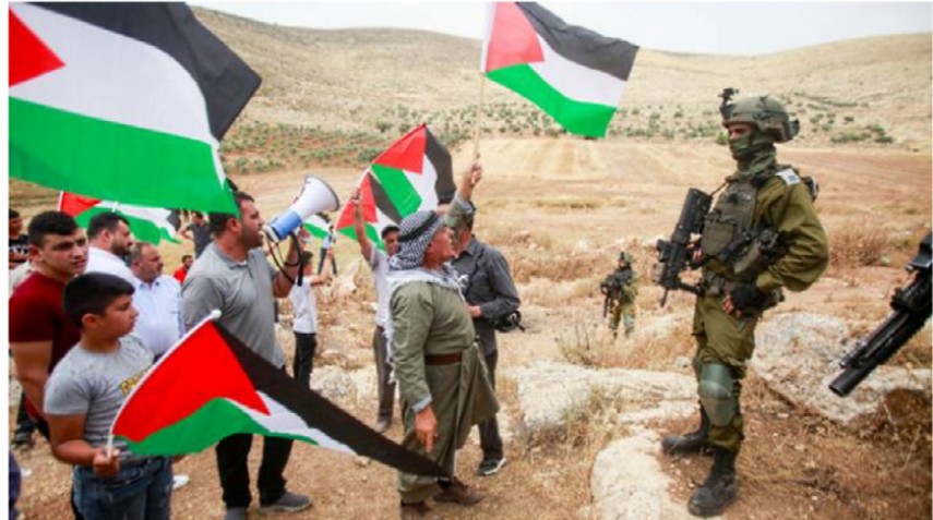
02.06.2023, Palästinensische Gebiete, Beit Dajan: Palästinenser streiten mit israelischen Sicherheitskräften während eines Protests gegen die Errichtung israelischer Außenposten.

Ein UN-Bericht dokumentiert hohe Opferzahlen israelischer Gewalt gegen Palästinenser: Seit Januar haben israelische Streitkräfte und Siedler 112 Palästinenser getötet und hunderte Häuser zerstört.