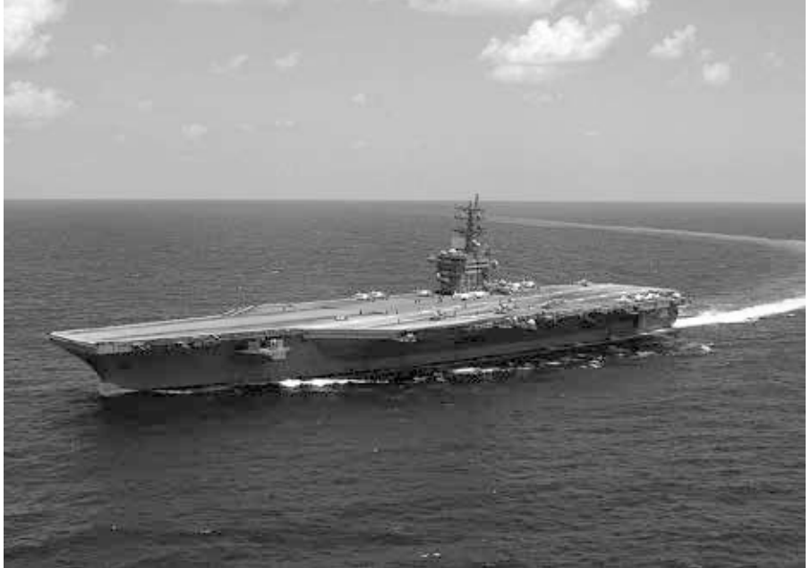
Flugzeugträger der Nimitz Klasse: USS Dwight D. Eisenhower. Der zweite Flugzeugträger der ins östliche Mittelmeer entsendet wurde.

Dieser Text wurde zuerst am 28.10.2023 auf www.vk.com unter der URL https://vk.com/@pepeasia-this-is-not-a-drill-iran-russia-corner-the-hegemon veröffentlicht. Lizenz: Pepe Escobar, CC BY-NC-ND 4.0