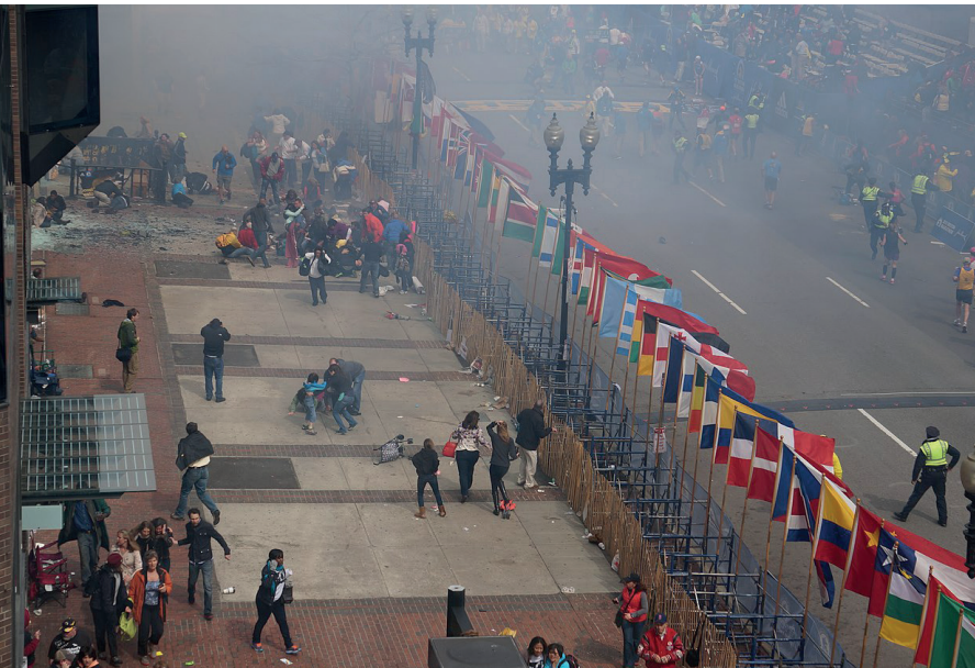
Kurz nach den Explosionen beim Anschlag auf den Boston-Marathon am 15. April 2013.

wurde aufgedeckt und musste abgebrochen werden [64].