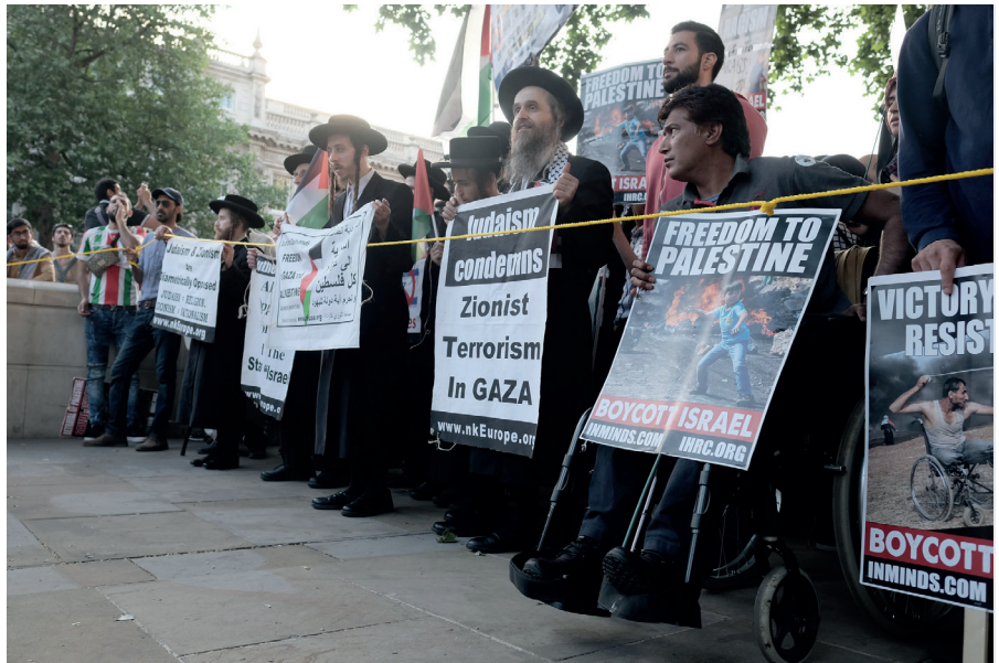
Vereint für Freiheit für Palästina. Eine Gruppe orthodoxer Juden und palästinensischer Solidaritätsaktivisten in Whitehall am Ende des Londoner Al-Quds-Marsches – alle vereint gegen die Tötung unbewaffneter Palästinenser durch Israel, 11.6.2018.

Dieser Text wurde zuerst im Oktober 2023 auf www.swprs.org unter der URL https://swprs.org/why-israel-created-hamas/ veröffentlicht. Lizenz: © Swiss Policy Research