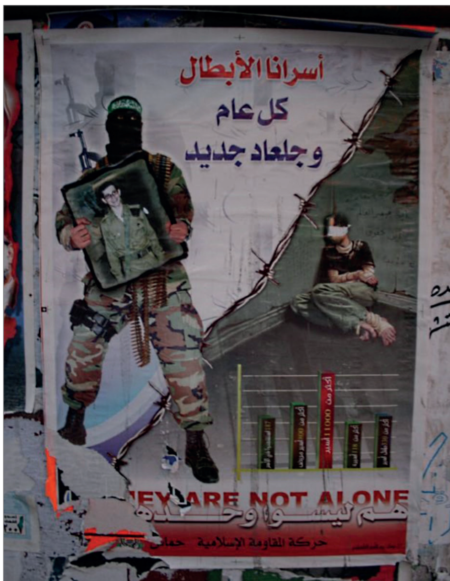
Geisler israelischer Soldat Gilad Shalit auf Hamas-Plakat, liest: "Unsere gefangenen Helden, mögen wir jedes Jahr einen neuen Gilad haben jedes Jahr" und unten: "Sie (palästinensische Gefangene) sind nicht allein", 1.5.2007.

Angesichts der Tatsache, dass das Hauptspiel beim zentralen Gerichtshof, wo wir jetzt spielen, die internationale Delegitimierung ist, schlägt uns [PA-Führer Mahmoud Abbas] in bedeutenden Bereichen. Und die Hamas wird meiner Meinung nach zu diesem Zeitpunkt eine Bereicherung sein. Ich glaube nicht, dass ich mir um [die Hamas] Sorgen machen muss.“ [36], [37]