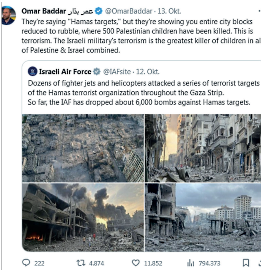
( https://twitter.com/OmarBaddar )

Es ist alles so, so schrecklich und so, so schmerzhaft dabei zuzusehen, Tag für Tag. Aber etwas bewegt sich im Hintergrund. Etwas Großes. Das Imperium hat seiner Fähigkeit, weiterhin alle im Tiefschlaf zu halten, irreparablen Schaden zugefügt. Eine gesunde Welt ist möglicherweise noch erreichbar.