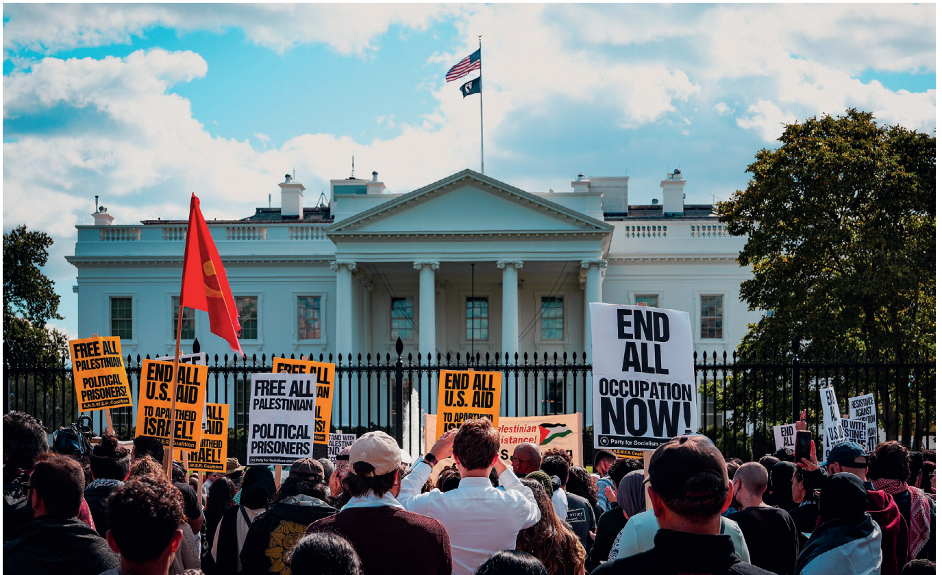
Protestversammlung vor dem Weißen Haus in Washington DC zur Unterstützung des palästinensischen Widerstands gegen Israel während des Krieges zwischen Israel und Gaza am 8.10.2023.

was die Hamas getan hat, es moralisch oder akzeptabel macht, Tausende Kinder zu ermorden.