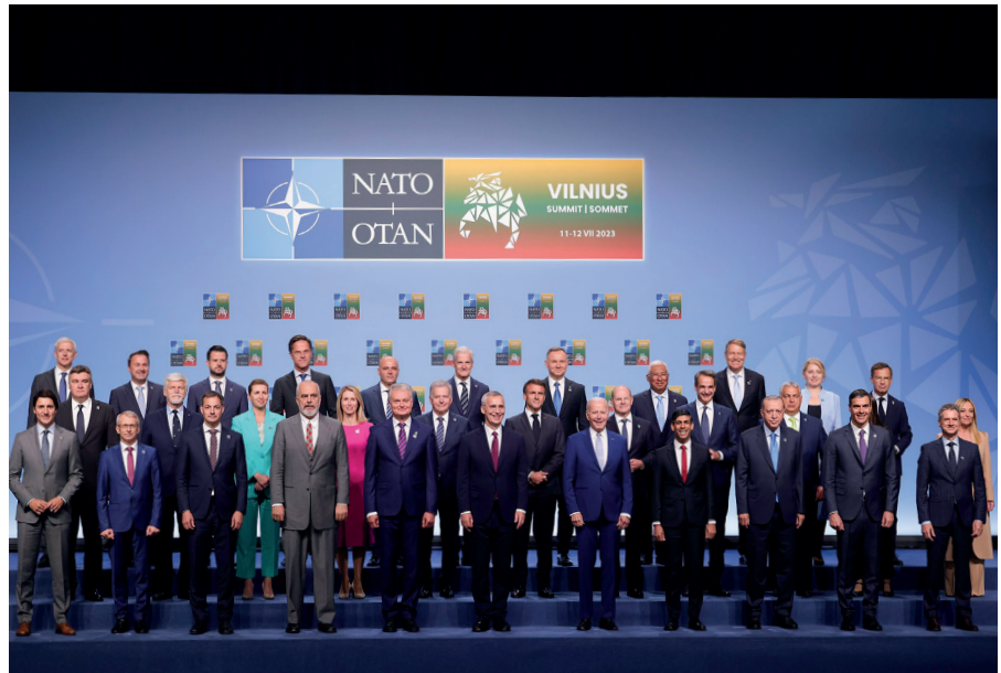
Gruppenbild der Teilnehmer am Nato-Gipfel in Vilnius am 11. Juli 2023.

Dieser Text wurde zuerst am 25.07.2023 auf www.theconversation.com unter der URL <https://theconversation.com/nato-isnt-the-only-alliance-that-countries-are-eager-to-join-a-brief-history-of-the-five-eyes-209763> veröffentlicht. Lizenz: Joshua Holzer, The Conversation, CC BY-NC-ND 4.0