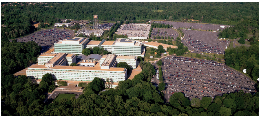
Hauptsitz der Central Intelligence Agency (CIA) in Langley, zwischen 1980 und 2006.

Und wie Sie wissen, ist OGA normalerweise ein Euphemismus für den Geheimdienst im Allgemeinen oder die CIA im Besonderen. Wir hatten E-Mails, aus denen hervorging, dass die CIA an einigen dieser Treffen teilnahm; dass sie darum bat, dabei zu sein. Wir hielten das für ziemlich belastendes Material, denn es zeigte nicht nur, dass all diese Unternehmen in regelmäßigem Kontakt mit den Bundesvollzugsbehörden standen, sondern auch, dass eine ziemlich ausgeklügelte wettbewerbswidrige Situation vorlag, über die, glaube ich, noch niemand nachgedacht hat. Die kartellrechtliche Komponente dieser Angelegenheit, bei der sich 20 oder 25 Technologieunternehmen zusammenschließen und geheime Absprachen darüber treffen, welche Art von Inhalten sie der Öffentlichkeit zeigen werden. Ich denke, das ist sehr ernst. Und das alles stand im Grunde in einer einzigen E-Mail.