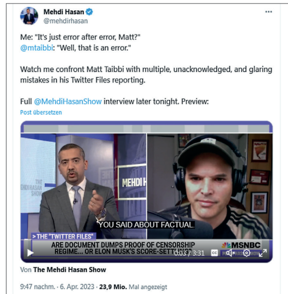
(Screenshot: https://twitter.com/mehdirhasan/status/1644064242419617803?lang=de )

Matt Taibbi: Nun, sie schauen wahrscheinlich gerade zum Kongress auf, oder? Es ist bemerkenswert, man würde denken, dass das unmöglich ist, richtig? Es ist wie der Woody-Allen-Witz, sie sind an diesem Punkt eine Stufe unter Kinderschändern. Aber wie Sie wissen, kann man das Vertrauen in die Medien nur zurückgewinnen, wenn man ehrlich zu den Leuten ist, Fehler eingesteht, ihnen in die Augen schaut und sagt: „Wir haben das falsch verstanden. Wir werden versuchen, beim nächsten Mal ehrlich zu sein.“ Das tun sie aber nicht. Stattdessen verschränken sie die Arme und sagen: „Wir sind die einzige Informationsquelle. Wir sind legitimiert, weil wir anerkannt sind, und das gibt uns eine Autorität, die anderen fehlt. Und wir wollen, dass Sie alle Informationen, die Sie aus anderen Quellen erhal-