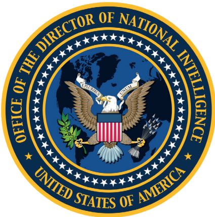
Seigel des Büros des Direktors des Nationalen Nachrichtendienstes.

von Aktion. Und das war eine wichtige Geschichte, die wir veröffentlichten. Ich war sehr nervös deswegen. Sie enthielt Informationen über die CIA, den DNI (Director of National Intelligence, Direktor der nationalen Geheimdienste; Anm. d. Redaktion), das Heimatschutzministerium und das FBI, und genau das wollte ich an Heiligabend tun.