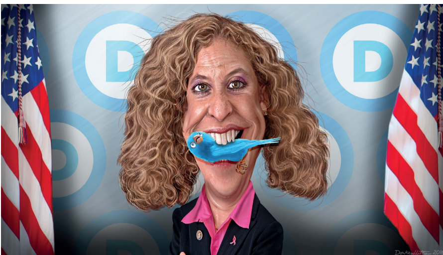
Karikatur von Debbie Wasserman Schultz, US-Abgeordnete für den 23. Kongressdistrikt in Florida und die Vorsitzende des Demokratischen Nationalkomitees.

Matt Taibbi: Richtig. Und für den amerikanischen Liberalismus von damals war die Logik dahinter, wie Sie wissen, nicht schwer zu verstehen.