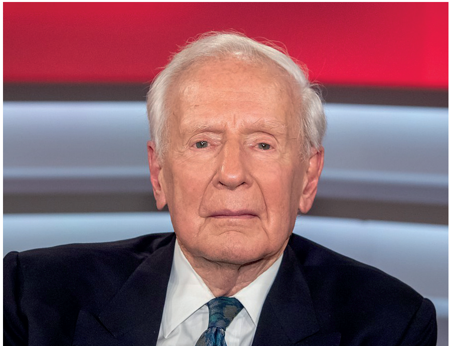
Klaus von Dohnanyi in der ARD Sendung Maischberger.

Dieser Text wurde zuerst am 04.06.2022 auf www.globalbridge.ch unter der URL < https://www.globalbridge.ch/klaus-von-dohnanyis-nationale-interessen-oder-dynamit-vom-elder-statesman/ > veröffentlicht. Lizenz: Leo Ensel, Global Bridge, CC BY-NC-ND 4.0