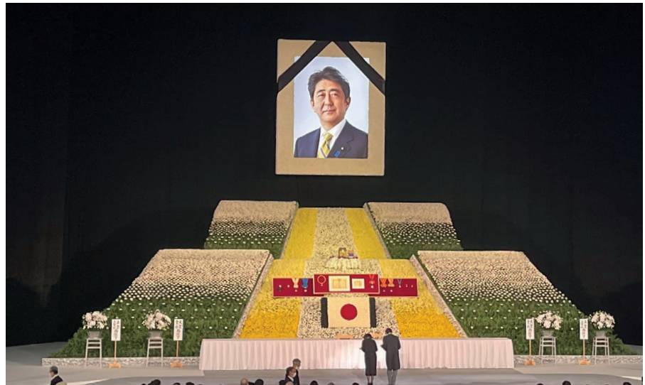
Staatsbegräbnis von Shinzo Abe am 27.9.2022.