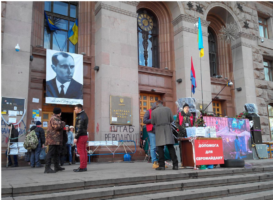
Porträt Banderas am Rathaus Kiew während des Euromaidan am 14. Januar 2014.

vielleicht auch anderen Geheimdiensten. Die Leugnung der Beteiligung am Hacking oder der Ermutigung dazu wird durch ihre eigenen Erklärungen untergraben, wie in dieser von einem der Hacker [67]: