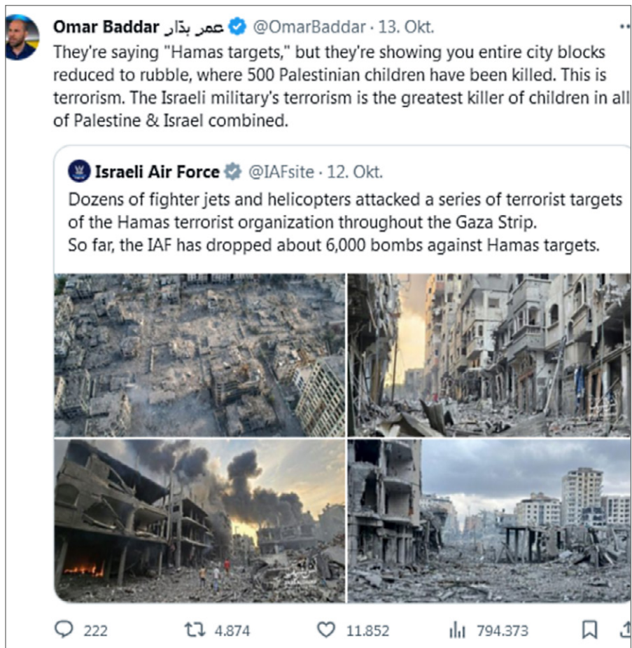
( https://twitter.com/OmarBaddar )