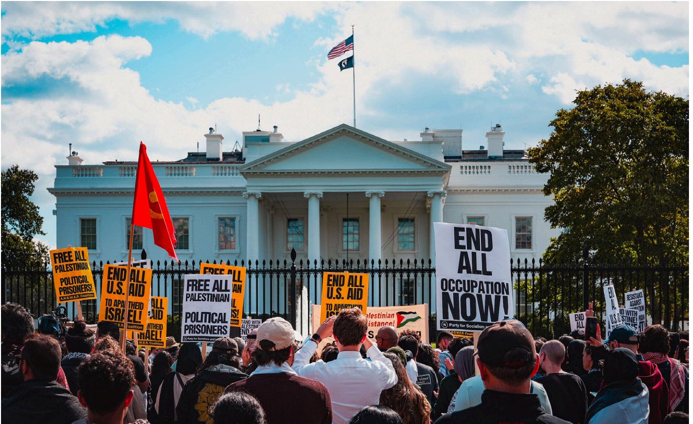
Protestversammlung vor dem Weißen Haus in Washington DC zur Unterstützung des palästinensischen Widerstands gegen Israel während des Krieges zwischen Israel und Gaza am 8.10.2023.

was die Hamas getan hat, es moralisch oder akzeptabel macht, Tausende Kinder zu ermorden.