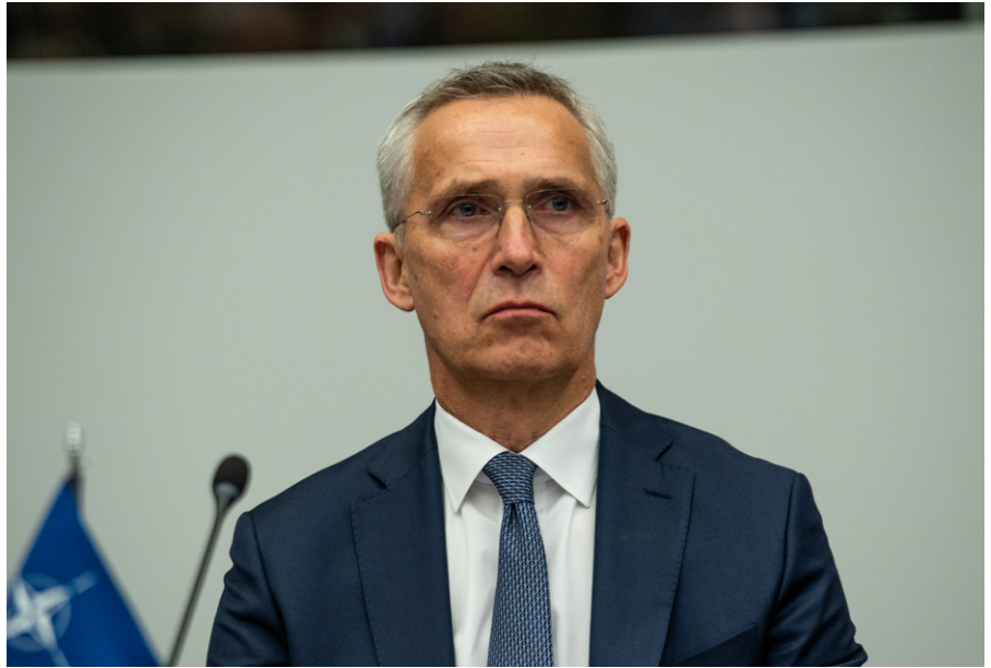
Der Norweger Jens Stoltenberg ist seit dem 1. Oktober 2014 NATO-Generalsekretär.