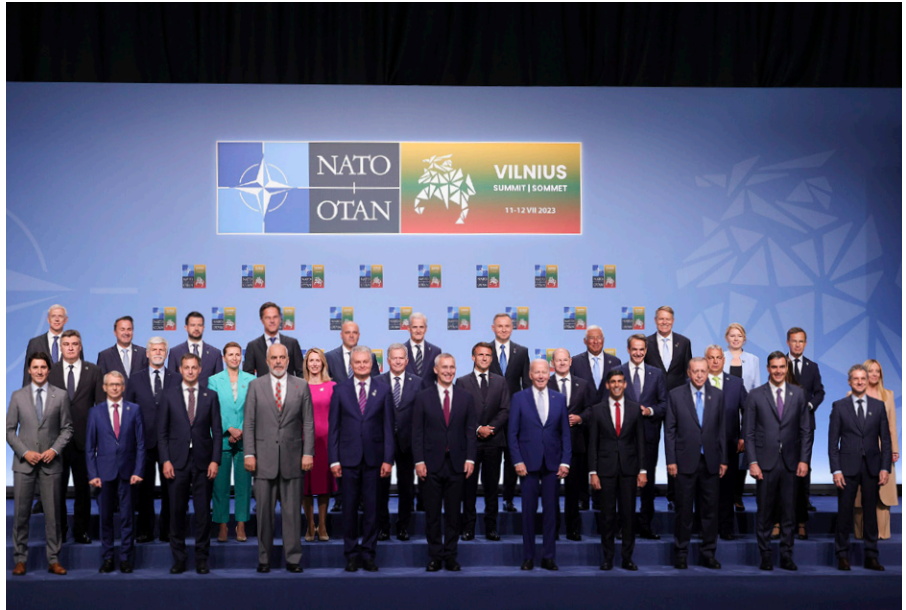
Gruppenbild der Teilnehmer am Nato-Gipfel in Vilnius am 11. Juli 2023.

Die NATO ist nicht das einzige Bündnis, dem weitere Länder gerne beitreten möchten