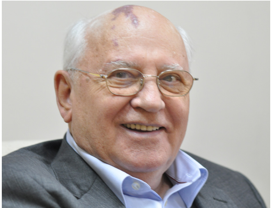
Michael Gorbatschow, 2010 (Wikimedia Commons)