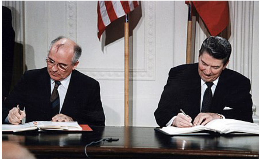
US-Präsident Reagan (rechts) und der sowjetische Generalsekretär Gorbatschow (links) unterzeichnen den INF-Vertrag im Weißen Haus, 8. Dezember 1987.

Der Rezensent kann sich an dieser Stelle einen eigenen Kommentar nicht verkneifen: Wenn auch nur ein Fakt gegen die – im Westen neuerdings wieder so beliebte – Gleichsetzung von Nationalsozialismus und Sowjetgesellschaft sprechen sollte, dann dies: Die Sowjetgesellschaft war letztlich in der Lage, sich – unter großen Mühen und immensen Geburtswehen, versteht sich – selbst zu reformieren, das diktatorische Regime abzuschütteln und sich zu einer grundlegend neuen Politik im Inneren durchzuringen und in der Außen- und Sicherheitspolitik sogar eine