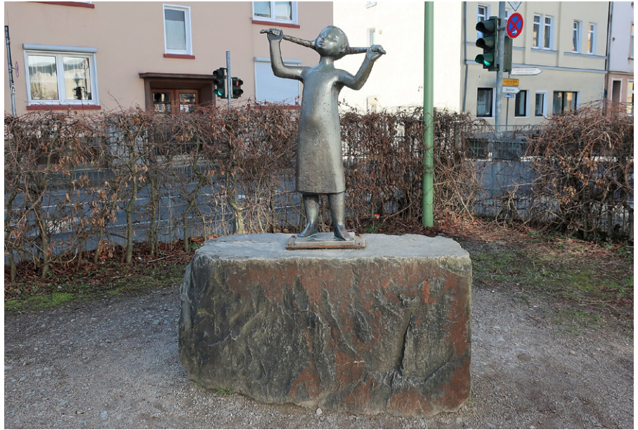
Skulptur „Pippi Langstrumpf“ vor der Astrid-Lindgren-Schule in Hagen-Delstern, 28.2.2021.