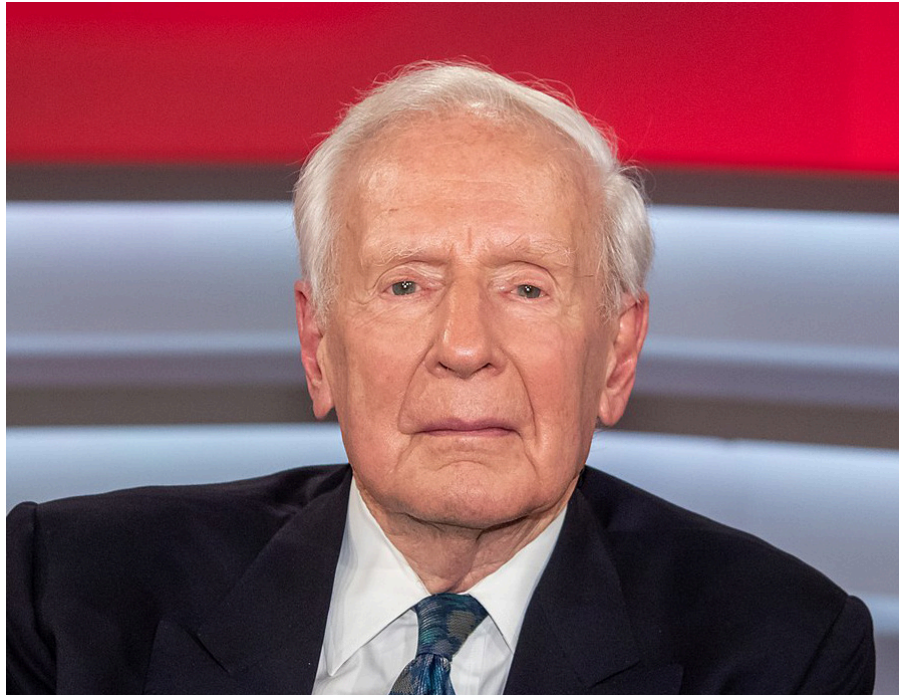
Klaus von Dohnanyi in der ARD Sendung Maischberger.

Dieser Text wurde zuerst am 04.06.2022 auf www.globalbridge.ch unter der URL <https://globalbridge.ch/klaus-von-dohnanyis-nationale-interessen-oder-dynamit-vom-elder-statesman/> veröffentlicht. Lizenz: Leo Ensel, Global Bridge, CC BY-NC-ND 4.0