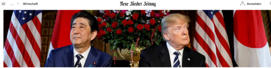
Das japanisch-amerikanische Verhältnis kennt Höhen und Tiefen: der japanische Premierminister Shinzo Abe und US-Präsident Donald Trump bei einem Treffen in Florida.