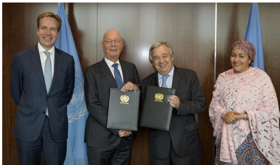
Die UN-Forum-Partnerschaft wurde in einem Treffen am Hauptsitz der Vereinten Nationen zwischen UN-Generalsekretär António Guterres und dem Gründer des Weltwirtschaftsforums und Exekutivvorsitzenden Klaus Schwab unterzeichnet.

Bewegt durch den mächtigen Fluss von Regierungsgeldern [70] machen die Big-