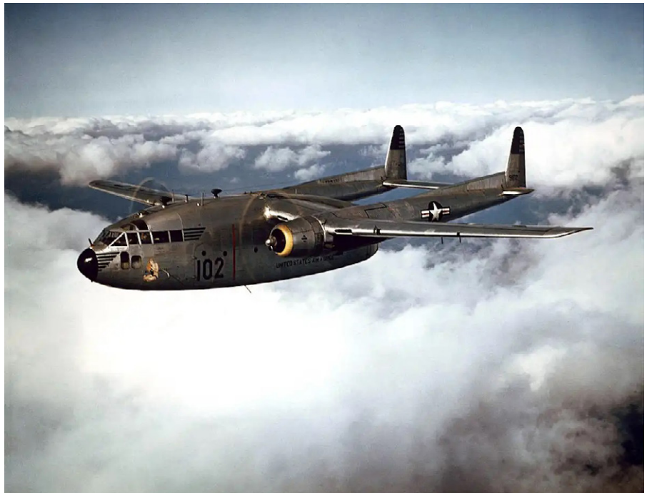
Flugzeuge wurden in den 1950er Jahren verwendet, um Chemikalien über Teile der USA zu verteilen.

Auch die Angehörigen der Streitkräfte, die von der Regierung zur Verteidigung der Nation herangezogen werden, wur-