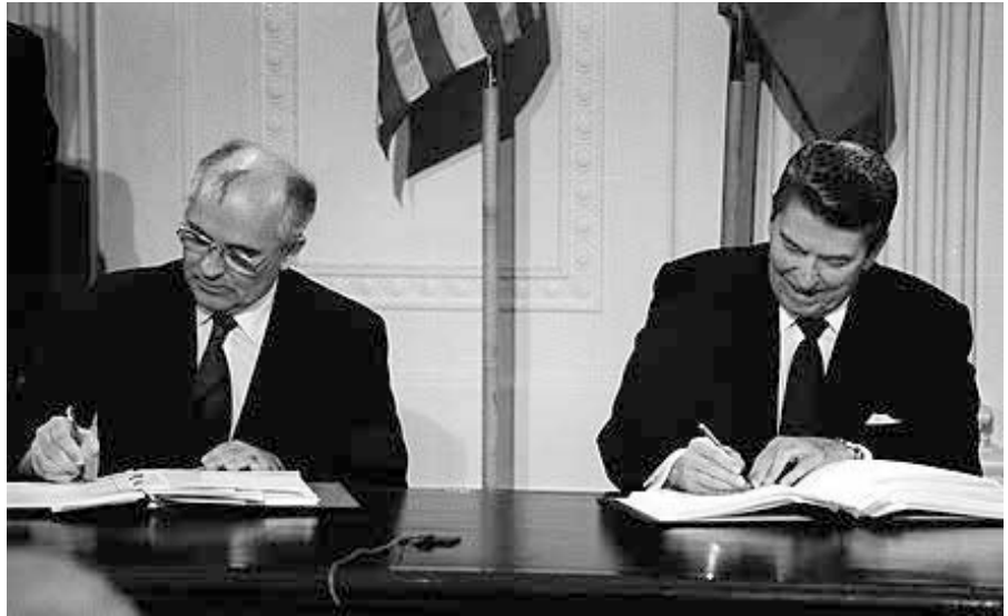
US-Präsident Reagan (rechts) und der sowjetische Generalsekretär Gorbatschow (links) unterzeichnen den INF-Vertrag im Weißen Haus, 8. Dezember 1987.

Der Rezensent kann sich an dieser Stelle einen eigenen Kommentar nicht verkneifen: Wenn auch nur ein Fakt gegen die – im Westen neuerdings wieder so beliebte – Gleichsetzung von Nationalsozialismus und Sowjetgesellschaft sprechen sollte, dann dies: Die Sowjetgesellschaft war letztlich in der Lage, sich – unter großen Mühen und immensen Geburtswehen, versteht sich – selbst zu reformieren, das diktatorische Regime abzuschütteln und sich zu einer grundlegend neuen Politik im Inneren durchzuringen und in der Außen- und Sicherheitspolitik sogar eine