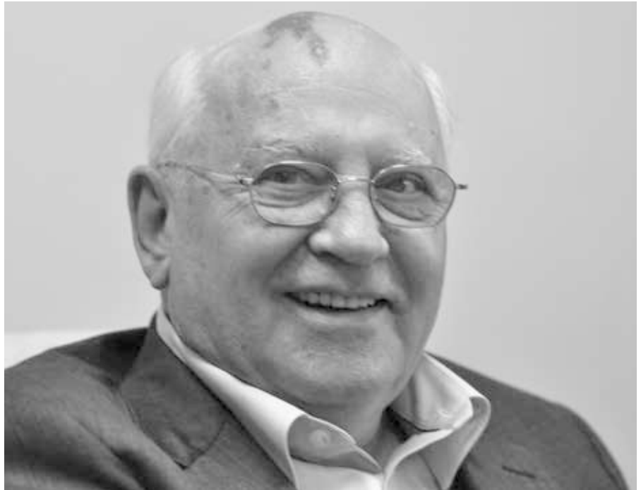
Michael Gorbatschow, 2010