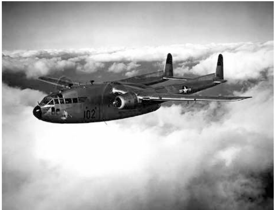
Flugzeuge wurden in den 1950er Jahren verwendet, um Chemikalien über Teile der USA zu verteilen.

Auch die Angehörigen der Streitkräfte, die von der Regierung zur Verteidigung der Nation herangezogen werden, wur-