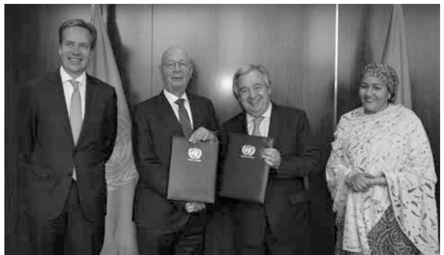
Die UN-Forum-Partnerschaft wurde in einem Treffen am Hauptsitz der Vereinten Nationen zwischen UN-Generalsekretär António Guterres und dem Gründer des Weltwirtschaftsforums und Exekutivvorsitzenden Klaus Schwab unterzeichnet.

Bewegt durch den mächtigen Fluss von Regierungsgeldern [70] machen die Big-