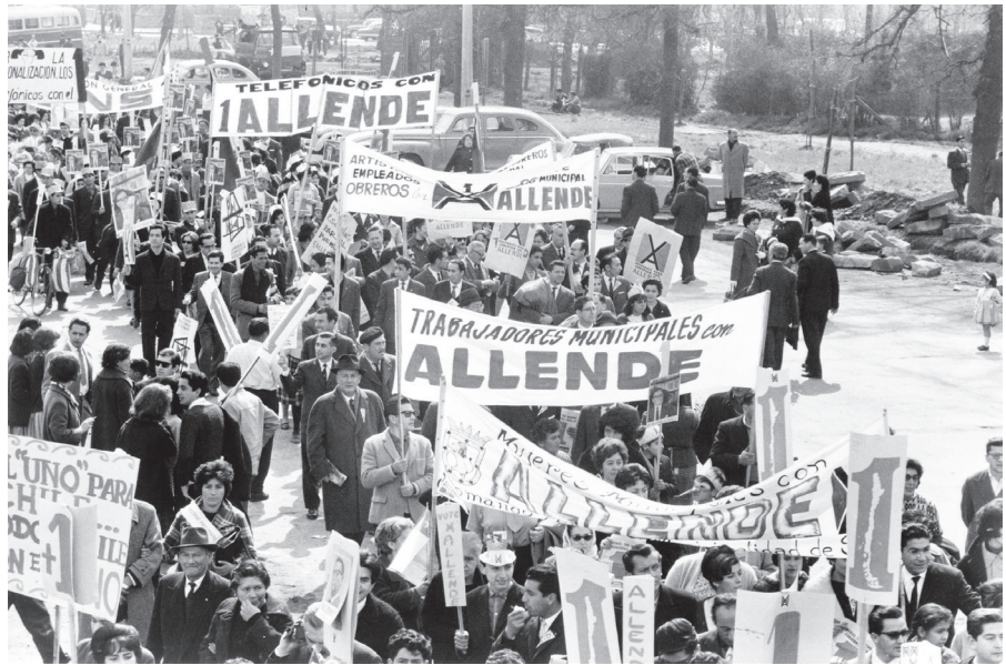
Demonstranten für Salvador Allende. Eine Menschenmenge, die für die Wahl von Salvador Allende zum Präsidenten in Santiago, Chile, demonstriert, 5 September 1964.

„Die Haltung der aktiven Verteidigung der Unabhängigkeit Chiles beinhaltet die Verurteilung der bestehenden „Organisation der Amerikanischen Staaten“