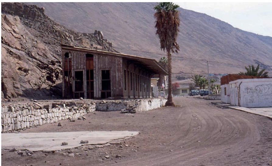
Ehemaliger Bahnhof Pisagua – rechts Reste des ehemaligen Konzentrationslagers des Pinochet-Regimes, 24.2.2002.

gierung Allende hat das Ende gefunden, das sie verdiente [...]. Chile wird in Zukunft ein für Hoehster Produkte zunehmend interessanter Markt sein.“ Der Spiegel urteilte am 8. Oktober 1973 zutreffend: „Auf Hilfe aus Bonn müssen die chilenischen Generale [...] nicht verzichten.“ [38]