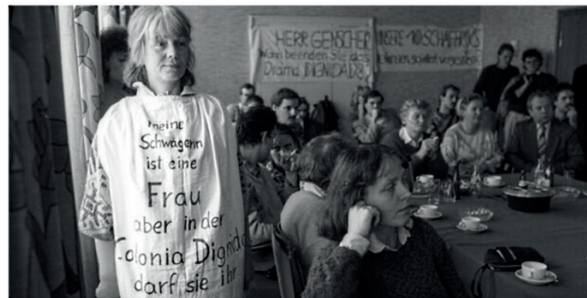
Schon 1988 war die Colonia Dignidad ein Thema im Auswärtigen Ausschuss. Demonstranten prangerten Menschenrechtsverletzungen an.

Viele Täter und Opfer der chilenischen Sekte sind Deutsche. Die CSU hatte engen Kontakt zur Führung, die deutsche Justiz blieb lange untätig.