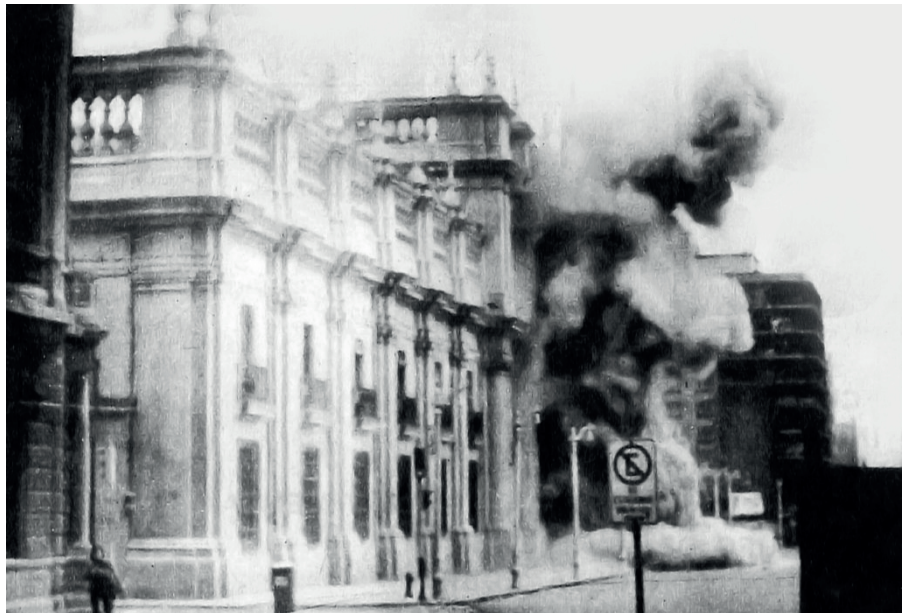
Putsch vom 11. September 1973. Bombardierung des Präsidentenpalasts La Moneda.

Dieser Text wurde zuerst am 12.09.2023 auf www.npla.de unter der URL https://www.npla.de/thema/memoria-justicia/brd-verstrickung-mit-der-chilenischen-diktatur-und-pinochet/ veröffentlicht. Lizenz: Susanne Brust und Ute Löhning, Nachrichtenpool Lateinamerika, CC BY-SA 4.0