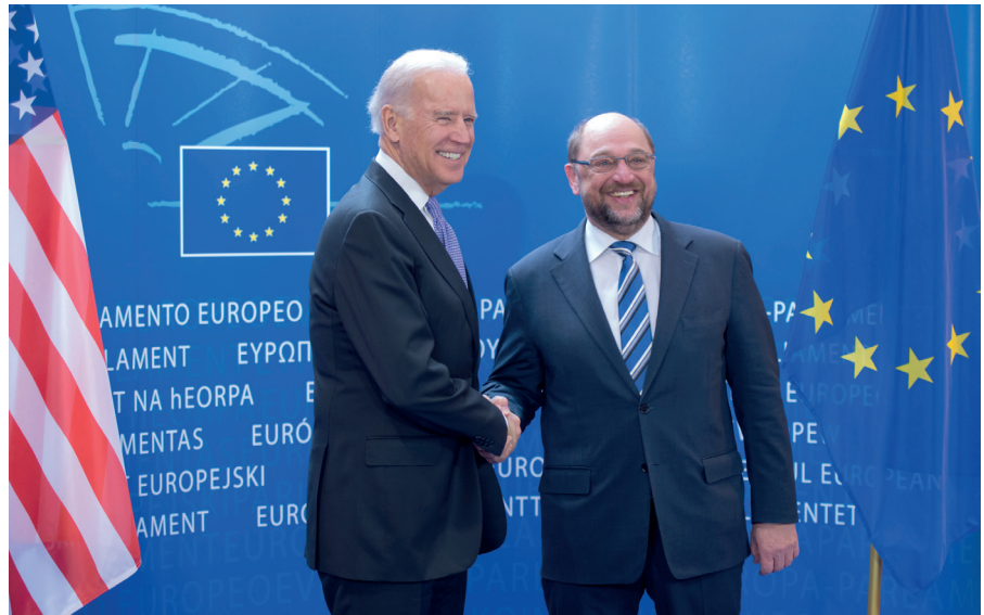
US-Vizepräsident Joe Biden besucht offiziell das Europäische Parlament (rechts: Martin Schulz), 6.2.2015.

Dieser Text wurde zuerst am 01.08.2023 auf www.tkp.at unter der URL <https://tkp.at/2023/08/01/the-empire-strikes-back-usa-planen-neue-ara-der-eu-beziehungen/> veröffentlicht. Lizenz: Assoc. Prof. Dr. Stephan Sander-Faes, tkp, CC BY-NC-ND 4.0