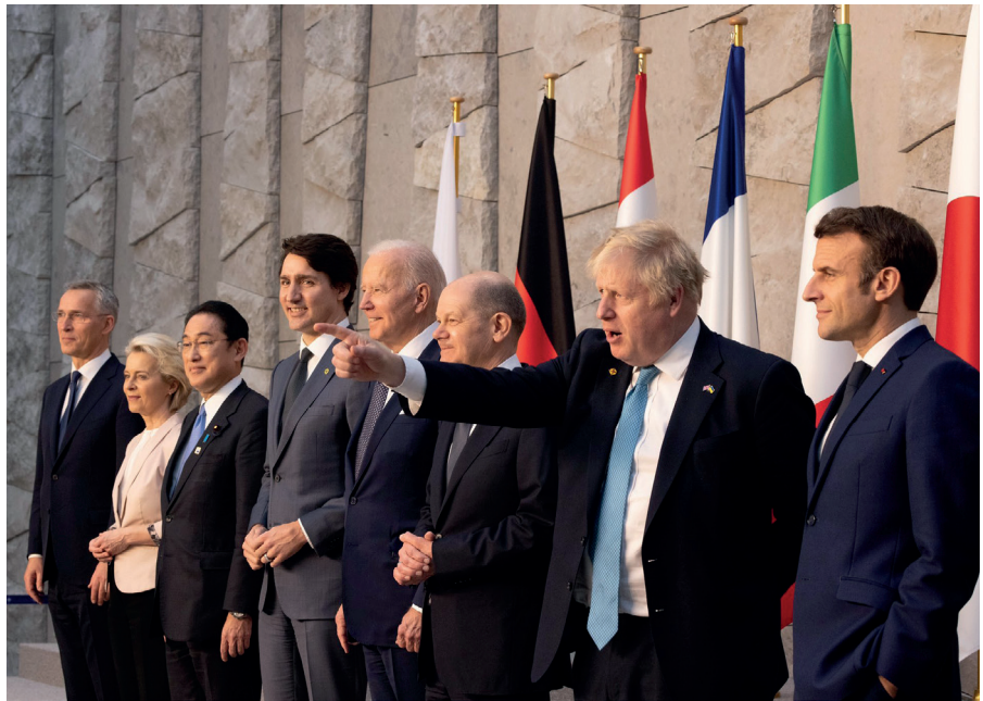
Von links nach rechts: NATO-Generalsekretär Jens Stoltenberg; Ursula von der Leyen (EU-Präsidentin); Fumio Kishida (Premierminister, Japan); Justin Trudeau (Premierminister, Kanada); US-Präsident Joe Biden; Bundeskanzler Olaf Scholz (Deutschland); Boris Johnson (Premierminister, Großbritannien); Präsident Emmanuel Macron (Frankreich), 25.3.2022.

In vielerlei Hinsicht sind diese Forderungen klar mehr als nur „alter Wein in neuen Schläuchen“.