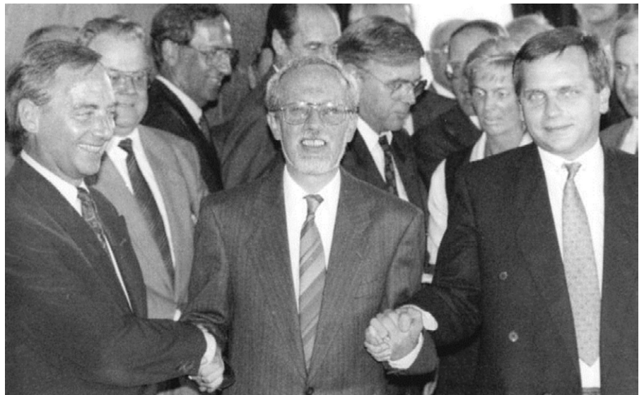
Der Einigungsvertrag über den Beitritt der DDR zur Bundesrepublik Deutschland wurde im Ostberliner Palast Unter den Linden unterzeichnet. Nach dem feierlichen Akt der Händedruck zwischen den Verhandlungsführern, Staatssekretär Dr. Günther Krause (r.) und Bundesinnenminister Wolfgang Schäuble (l.), und dem DDR-Ministerpräsidenten Lothar de Maiziere (M.), Berlin, 31.8.1990.

Auf Bundesebene war Schäuble seit 1984 an nahezu allen CDU-geführten Regierungsgeschäften beteiligt. Mit Aus-