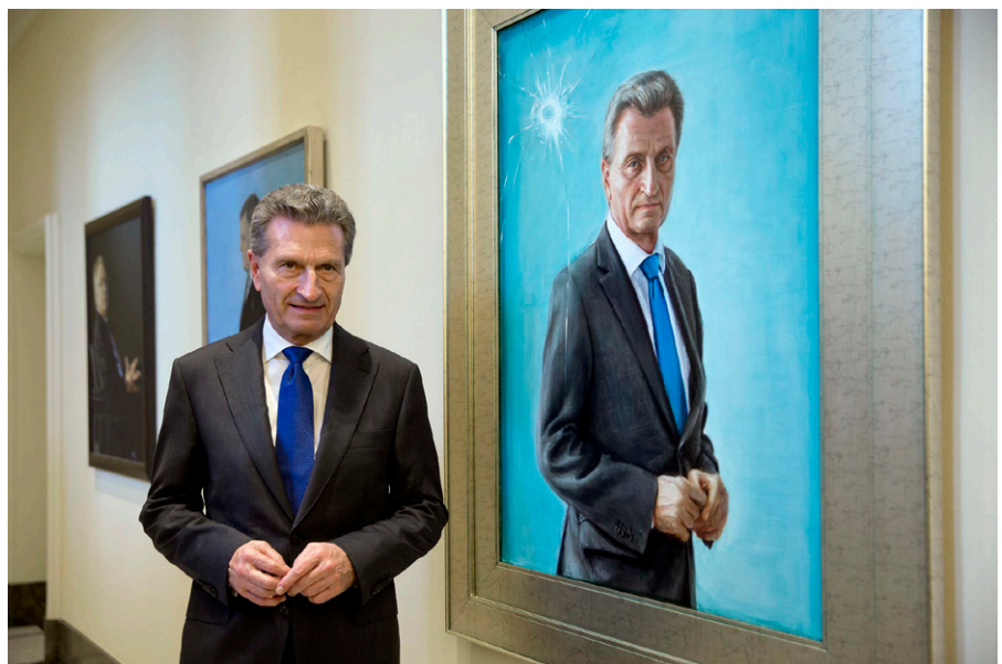
Der ehemalige Ministerpräsident Günther Oettinger steht neben seinem Porträt in der Porträtgalerie der Ministerpräsidenten Baden-Württembergs, 29.1.2016.

Um zu verstehen, wie die EU derzeit funktioniert, ist es wichtig zu wissen, dass „beschädigte“ Politiker häufig von den Mitgliedstaaten „befördert“ und nach Brüssel geschickt werden. Dies ist sicherlich der Fall bei Ursula von der Leyen, deren Erfolgsbilanz in Deutschland – in ihrer Amtszeit als Verteidigungsministerin wurden die Fähigkeiten der Bundeswehr immer schlechter, während sie Beraterverträge im Wert von 150 Millionen Euro pro Jahr vergab, was vom Bundesrechnungs-