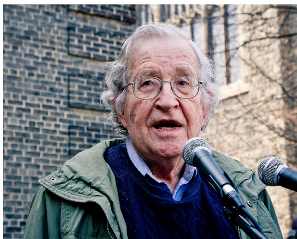
Noam Chomsky bei einer Rede für die Occupy-Wall-Street-Bewegung, 7.4.2011

Kurz, die Russen müssen beweisen, dass sie nicht die Absicht haben, sich mit der