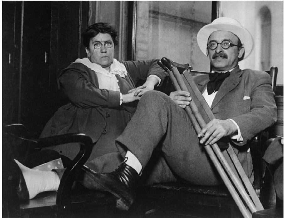
Alexander Berkman zusammen mit Emma Goldman.

Im Anarchismus wird jeder die Möglichkeit haben, der seinen natürlichen Neigungen und Fähigkeiten entsprechenden Beschäftigung nachzugehen. Anders als die betäubende Plackerei heute wird Arbeit dann zum Vergnügen werden. Faulheit wird unbekannt und die mit In-