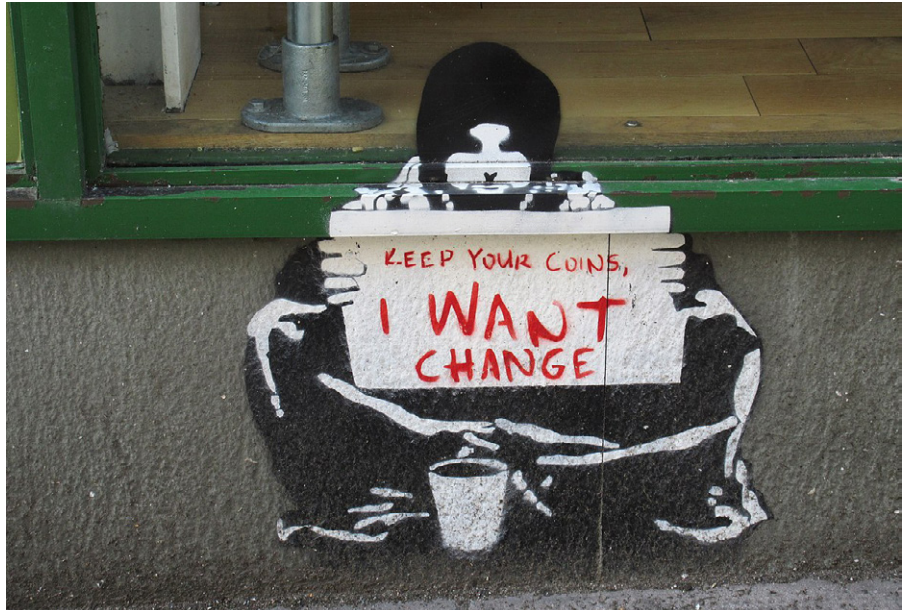
Banksy Streetart: Keep your coins – I want change.

Dieser Text wurde auf www.anarchismus.at unter der URL https://www.anarchismus.at/anarchistische-klasiker/alexander-berkman/83-alexander-berkman-abc-des-anarchismus veröffentlicht. Lizenz: anarchismus.at, CC BY-NC-SA 3.0 DE