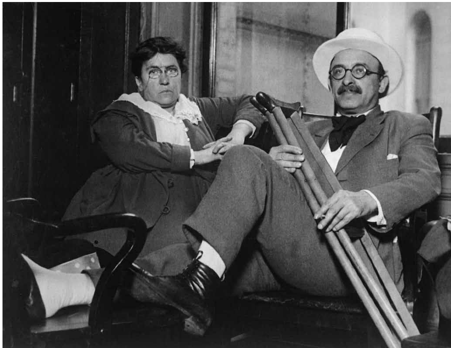
Alexander Berkman zusammen mit Emma Goldman.

Im Anarchismus wird jeder die Möglichkeit haben, der seinen natürlichen Neigungen und Fähigkeiten entsprechenden Beschäftigung nachzugehen. Anders als die betäubende Plackerei heute wird Arbeit dann zum Vergnügen werden. Faulheit wird unbekannt und die mit In-