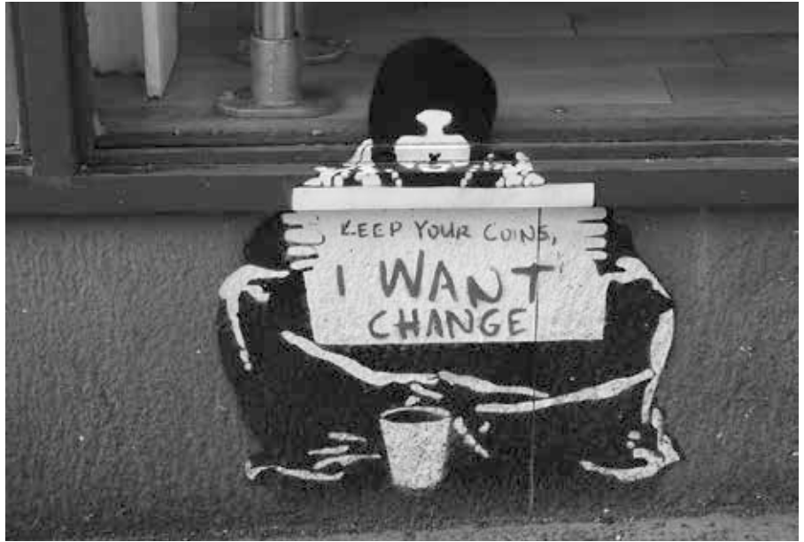
Banksy Streetart: Keep your coins – I want change.

Dieser Text wurde auf www.anarchismus.at unter der URL https://www.anarchismus.at/anarchistische-klasiker/alexander-berkman/83-alexander-berkman-abc-des-anarchismus veröffentlicht. Lizenz: anarchismus.at, CC BY-NC-SA 3.0 DE