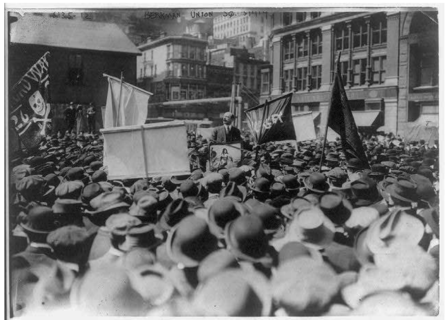
Alexander Berkman spricht am 1. Mai 1914 auf dem Union Square.

Das heißt, dass der Austausch entsprechend dem Wert erfolgen muss. Aber da der Wert unsicher oder nicht bestimmbar ist, muss der Warenaustausch auf