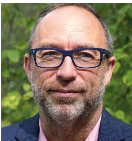
Medstifter af Wikipedia , Jimmy Wales.

rer valgte ikke at fortsætte. I mellemtiden har hjemmesidens kerne af aktive redaktører været faldende med 40 % fra 2007 til 2015 til omkring 30.000 redaktører[1]. I 2007 rapporterede Purdue Universitet, at kun 1 % af disse redaktører havde udført 77 % af samtlige rettelser[2]. Antallet af afviste ændringer steg fra 6 % i 2006 til 25 % i 2010[3], og siden afviser 1.000 IP-adresser om dagen[4]. "Redigeringskrige" løses ved at gøre dem tavse. Redaktører, som i længden udholder at blive administratorer med mulighed for at fryse og slette indlæg, føler sig ikke længere tvunget til at holde sig til Wikipedias regler, og statistisk viser det sig, at antallet af redaktører der kan godkendes til at blive administrator er styrtdykket siden 2007[5]. Wikipedia er et oligarki med alle de problemer, som det indeholder. Et sæt regler gælder for almindelige brugere, og et andet for den herskende klasse af administratorer og ledende redaktører.