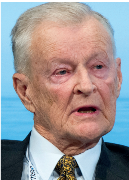
50. Münchner Sicherheitskonferenz 2014: Zbigniew Brzezinski (Ehemaliger Nationaler Sicherheitsberater der Vereinigten Staaten; Berater und Treuhänder, Zentrum für Strategische und Internationale Studien), 1.2.2014.

Was weder Maddow noch Clinton erwähnten – als sie über Freiwillige sprachen, die für die Ukraine kämpfen werden – ist das, was die New York Times am 25. Februar, einen Tag nach der Invasion und vor ihrem Interview, berichtete: „Rechtsextreme Milizen in Europa planen, sich den russischen Streitkräften entgegenzustellen.“ [34]