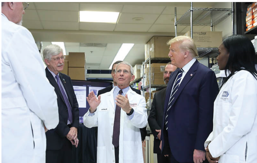
Præsident Donald J. Trump besøger Viral Pathogenesis Laboratory på National Institutes of Health i Bethesda, Maryland, tirsdag den 3. marts 2020.