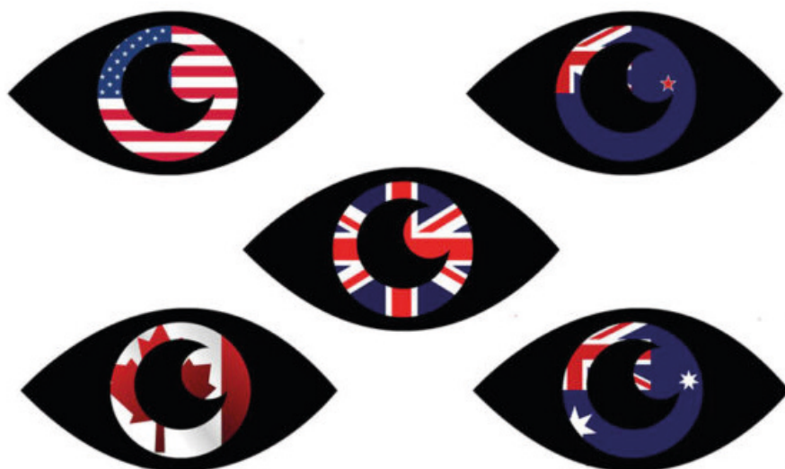
„The Five Eyes”. Foto: Nachtschatten1806 på Pixabay. Licens: Public domain.

Selv komikere sent på aftenen blev rekrutteret til propagandakampagnen: