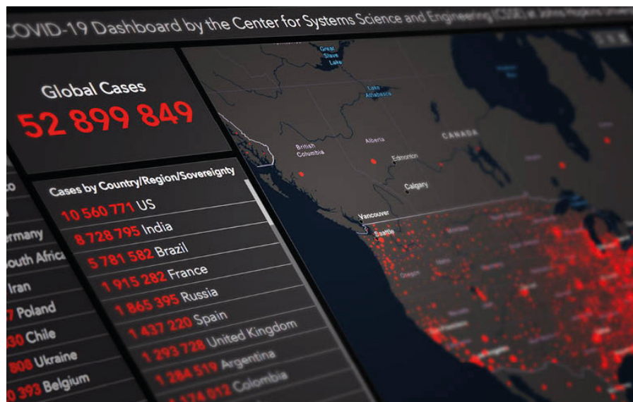
Coronavirus-dashboard med kort og statistik.

[35] See also https://archive.org/ Ed Dowd: "Cause Unknown; The Epidemic Of Sudden Deaths In 2021 & 2022". 2022 with a foreword by Robert Kennedy Jr. "noting that during the third and fourth quarters of 2021, which coincided with a period of mass vaccination, the number of Deaths among people of working age (18-64) was 40 percent higher than before the pandemic, with most deaths not attributable to COVID". < https://archive.org/details/cause-unknown-the-epidemic-of-sudden-deaths-in-2021-2022-2022-ed-dowd >