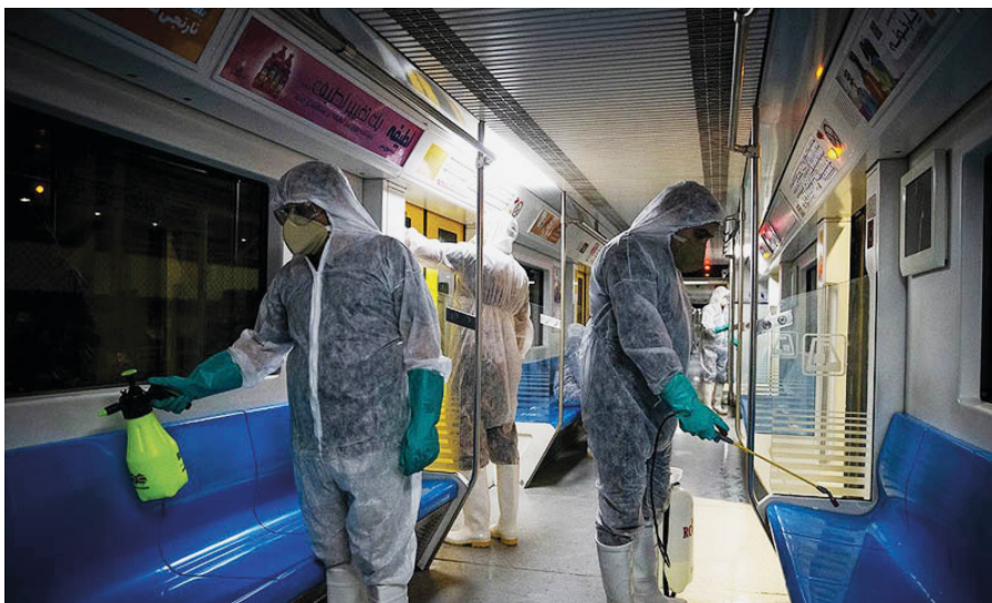
Desinfektionsdamp desinficerer en metro. Foto: Zoheir Seidanloo på Wikimedia. Licens: CC BY 4.0.