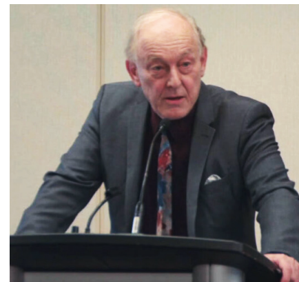
Canadisk økonom og forfatter Michel Chossudovsky.

Ifølge Chossudovsky har COVID-19-pandemien resulteret i et de facto statskup fra milliardærklassens side, der spredte panik blandt befolkningen, så de ville suspendere rationel dømmekraft og afgive deres borgerrettigheder med påbuddet om medicinsk unødvendige nedlukninger, krav om afstand og mundbind samt vaccinepas.