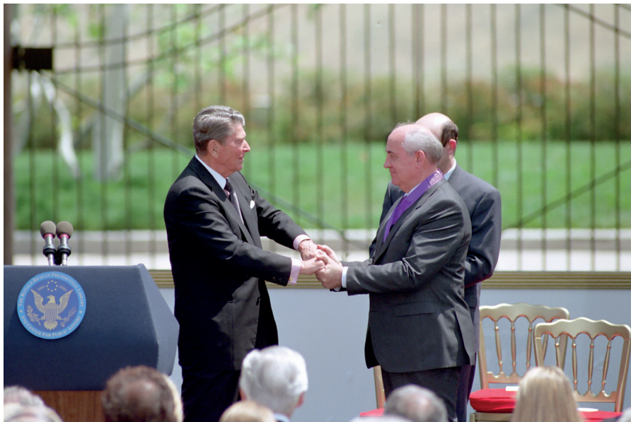
Michail Gorbatschow erhält die Reagan Freedom Medal vom ehemaligen US-Präsidenten Roland Reagan überreicht.

Es sollte noch weitere Jahrzehnte dauern, bis das Neue Denken mit seinen grundlegenden Momenten – Priorität der allgemein menschlichen Interessen als Voraussetzung zur Befriedigung aller übrigen Interessen, Bekämpfung der menschenbedrohenden Gefahren (Massenvernichtungsmittel, ökologische Katastrophe) und Verzicht auf Gewalt – endlich die Ebene der Politik erreichte. In den Achtziger Jahren betrat es in Gestalt von zwei Akteuren die weltpolitische Bühne: in Westeuropa als Friedensbewegung, die, in Reaktion auf die drohende Stationie-