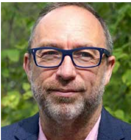
Medstifter af Wikipedia , Jimmy Wales.

rer valgte ikke at fortsætte. I mellemtiden har hjemmesidens kerne af aktive redaktører været faldende med 40 % fra 2007 til 2015 til omkring 30.000 redaktører[1]. I 2007 rapporterede Purdue Universitet, at kun 1 % af disse redaktører havde udført 77 % af samtlige rettelser[2]. Antallet af afviste ændringer steg fra 6 % i 2006 til 25 % i 2010[3], og siden afviser 1.000 IP-adresser om dagen[4]. "Redigeringskrige" løses ved at gøre dem tavse. Redaktører, som i længden udholder at blive administratorer med mulighed for at fryse og slette indlæg, føler sig ikke længe tvunget til at holde sig til Wikipedias regler, og statistisk viser det sig, at antallet af redaktører der kan godkendes til at blive administrator er styrtdykket siden 2007[5]. Wikipedia er et oligarki med alle de problemer, som det indeholder. Et sæt regler gælder for almindelige brugere, og et andet for den herskende klasse af administratorer og ledende redaktører.