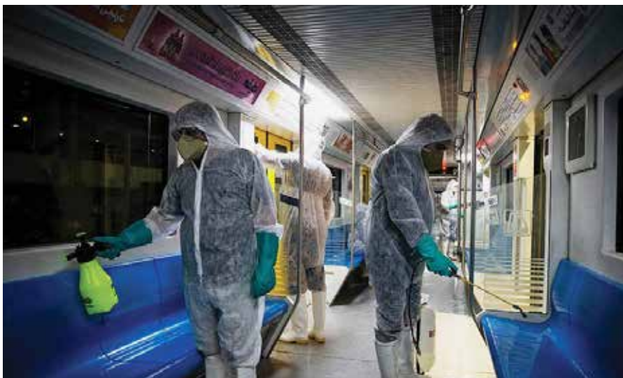
Desinfektionsdamp desinficerer en metro. Foto: Zoheir Seidanloo på Wikimedia. Licens: CC BY 4.0.