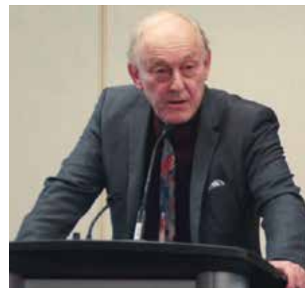
Canadisk økonom og forfatter Michel Chossudovsky.

Ifølge Chossudovsky har COVID-19-pandemien resulteret i et de facto statskup fra milliardærklassens side, der spredte panik blandt befolkningen, så de ville suspendere rationel dømmekraft og afgive deres borgerrettigheder med påbuddet om medicinsk unødvendige nedlukninger, krav om afstand og mundbind samt vaccinepas.