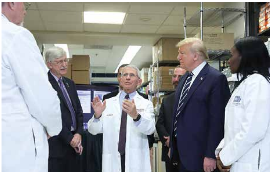
Præsident Donald J. Trump besøger Viral Pathogenesis Laboratory på National Institutes of Health i Bethesda, Maryland, tirsdag den 3. marts 2020.