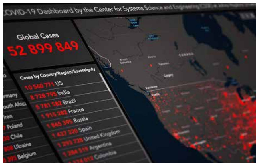
Coronavirus-dashboard med kort og statistik.

[35] See also https://archive.org/Ed-Dowd-Cause-Unknown-The-Epidemic-Of-Sudden-Deaths-In-2021-2022 ". 2022 with a foreword by Robert Kennedy Jr. "noting that during the third and fourth quarters of 2021, which coincided with a period of mass vaccination, the number of Deaths among people of working age (18-64) was 40 percent higher than before the pandemic, with most deaths not attributable to COVID". < https://archive.org/details/cause-unknown-the-epidemic-of-sudden-deaths-in-2021-2022-2022-ed-dowd >