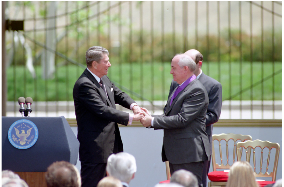
Michail Gorbatschow erhält die Reagan Freedom Medal vom ehemaligen US-Präsidenten Roland Reagan überreicht.

Es sollte noch weitere Jahrzehnte dauern, bis das Neue Denken mit seinen grundlegenden Momenten – Priorität der allgemein menschlichen Interessen als Voraussetzung zur Befriedigung aller übrigen Interessen, Bekämpfung der menschenbedrohenden Gefahren (Massenvernichtungsmittel, ökologische Katastrophe) und Verzicht auf Gewalt – endlich die Ebene der Politik erreichte. In den Achtziger Jahren betrat es in Gestalt von zwei Akteuren die weltpolitische Bühne: in Westeuropa als Friedensbewegung, die, in Reaktion auf die drohende Stationie-