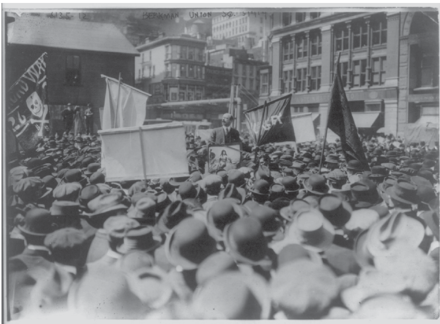
Anarchist Alexander Berkman spricht auf dem Union Square, NYC 1. Mai 1914

„Aber wer wird uns vor Verbrechen und Verbrechen schützen?“ fragen Sie. Fragen Sie sich lieber, ob uns die Regierung wirklich davor schützt. Schafft und hält die Regierung nicht selbst die Zustände aufrecht, die das Verbrechen fördern? Kultivieren nicht Einmischung und Gewalt, worauf alle Regierungen beruhen, den Geist der Intoleranz und Verfolgung, des Hasses und von noch mehr Gewalt? Steigt das Verbrechen nicht mit dem An-