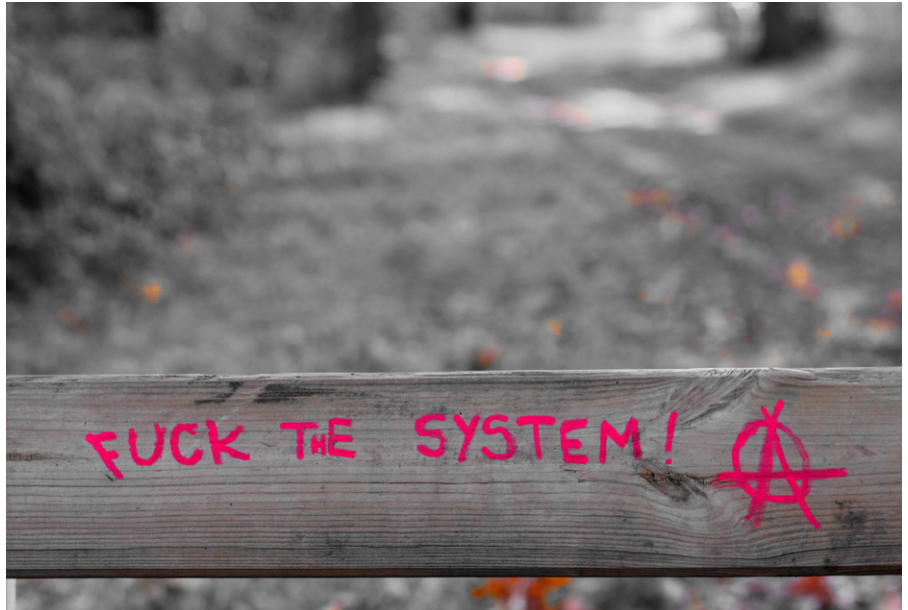
Fuck the system - Anarchismus