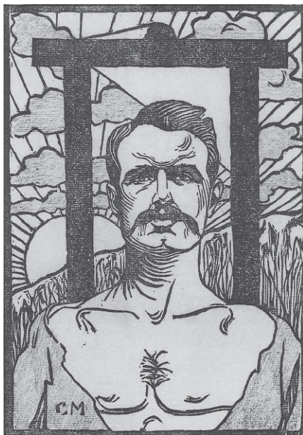
Der französische Anarchist Ravachol war ein Verfechter der Propaganda der Tat durch Gewalt: Als Rache für getötete Demonstranten verübte er Bombenanschläge und wurde dafür guillotiniert.

Hier ist der springende Punkt. Wie ist das allgemeine Verhältnis zur Gewalt? Wir werden die Sache nur verstehen, wenn wir diese Frage korrekt beantworten können. Wenn wir ehrlich sind, müssen wir zugeben, dass jeder von uns an Gewalt glaubt und sie auch praktiziert, wenngleich er sie bei anderen auch verurteilen mag. In der Tat basieren sämtliche von uns unterstützten Institutionen und das gesamte Leben der gegenwärtigen Gesellschaft auf Gewalt. Was ist das, was wir Regierung nennen? Ist sie etwas anderes als organisierte Gewalt? Das Gesetz schreibt Ihnen vor, was Sie zu tun oder Sie nicht zu tun haben, und wenn Sie ihm nicht gehorchen, dann werden Sie mit Gewalt dazu gezwungen. Wir diskutieren jetzt nicht, ob es richtig oder falsch ist, ob es so oder nicht so sein soll-