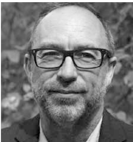
Medstifter af Wikipedia , Jimmy Wales.

rer valgte ikke at fortsætte. I mellemtiden har hjemmesidens kerne af aktive redaktører været faldende med 40 % fra 2007 til 2015 til omkring 30.000 redaktører[1]. I 2007 rapporterede Purdue Universitet, at kun 1 % af disse redaktører havde udført 77 % af samtlige rettelser[2]. Antallet af afviste ændringer steg fra 6 % i 2006 til 25 % i 2010[3], og siden afviser 1.000 IP-adresser om dagen[4]. "Redigeringskrige" løses ved at gøre dem tavse. Redaktører, som i længden udholder at blive administratorer med mulighed for at fryse og slette indlæg, føler sig ikke længe tvunget til at holde sig til Wikipedias regler, og statistisk viser det sig, at antallet af redaktører der kan godkendes til at blive administrator er styrtdykket siden 2007[5]. Wikipedia er et oligarki med alle de problemer, som det indeholder. Et sæt regler gælder for almindelige brugere, og et andet for den herskende klasse af administratorer og ledende redaktører.