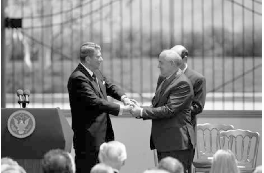
Michail Gorbatschow erhält die Reagan Freedom Medal vom ehemaligen US-Präsidenten Roland Reagan überreicht.

Es sollte noch weitere Jahrzehnte dauern, bis das Neue Denken mit seinen grundlegenden Momenten – Priorität der allgemein menschlichen Interessen als Voraussetzung zur Befriedigung aller übrigen Interessen, Bekämpfung der menschenbedrohenden Gefahren (Massenvernichtungsmittel, ökologische Katastrophe) und Verzicht auf Gewalt – endlich die Ebene der Politik erreichte. In den Achtziger Jahren betrat es in Gestalt von zwei Akteuren die weltpolitische Bühne: in Westeuropa als Friedensbewegung, die, in Reaktion auf die drohende Stationie-