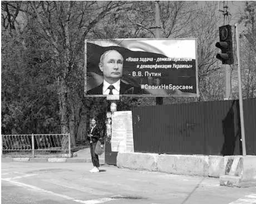
„Unsere Aufgabe – Demilitarisierung und Entnazifizierung der Ukraine.“

gegenwärtigen Präsidenten Wolodymyr Selenskyj hat er mehrfach als eine „Bande von Drogenabhängigen, Neonazis und Terroristen“ bezeichnet [4]. – Was ist von diesem Vorwurf zu halten?