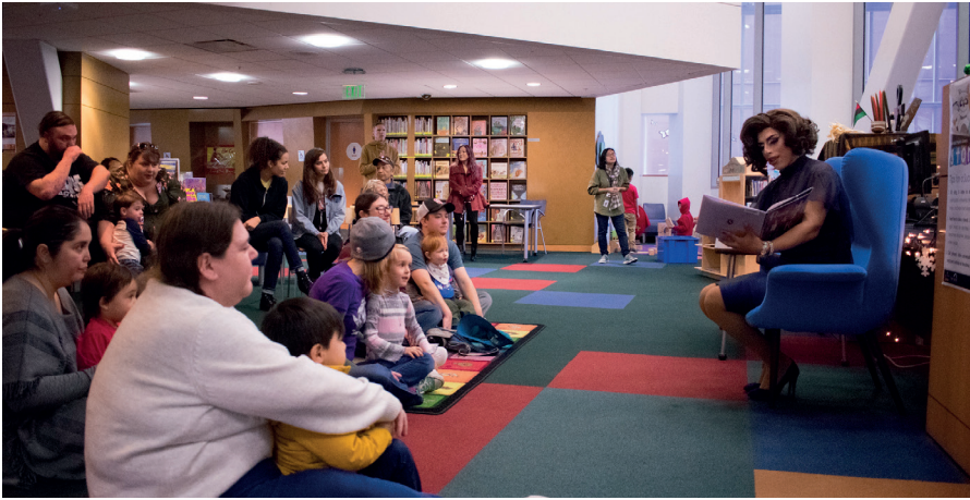
Drag Queen Märchstunde (3), 31.1.2019

nahmen, Ukraine-Krieg [14] oder eben Drag Queen-Lesungen für Kinder.