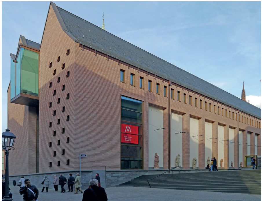
Das Historische Museum Frankfurt (2018) von Osten (Eingangsseite) aus.

Dieser Text wurde zuerst am 14.07.2023 auf www.free21.org unter der URL < https://free21.org/demokratie-ade > veröffentlicht. Lizenz: Free21, CC BY-NC-ND 4.0