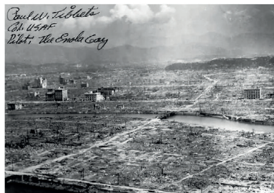
Bild des zerstörten Hiroshima mit Autogramm Paul Tibbets'