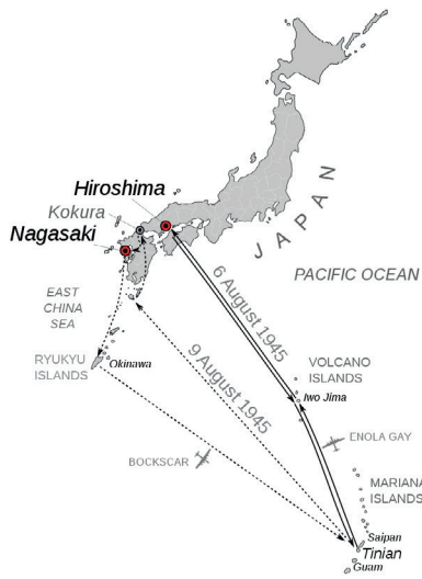
Flugrouten zu den Zielen am 6. und 9. August 1945