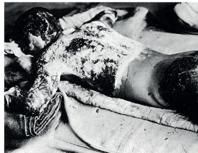
Ein Opfer der Bombe in Hiroshima (7. August 1945)