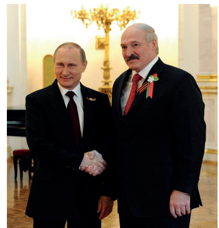
Vor Beginn des informellen Treffens der Staatsoberhäupter der GUS. Wladimir Putin mit dem Präsidenten von Belarus, Alexander Lukaschenko, 8.5.2015.

Am frühen Abend des 1. Putschtages kam die Überraschung: Prigoschin stoppt den Marsch auf Moskau, lässt umdrehen und die Feldlager wieder beziehen.