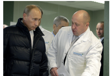
Premierminister Wladimir Putin, hier mit Inhaber Prigoschin, besichtigt die neue Fabrik Concord, die Schulen mit Fertiggerichten beliefert, 20.9.2010.

Prigoschin in der Nachfolge von Lenin und Trotzki?