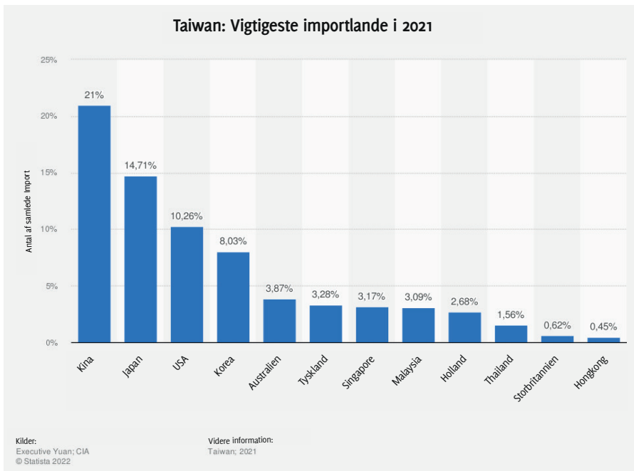
Taiwan: De vigtigste importlande i 2021.

kraftigt i sit militær og forbereder sig faktisk på en konflikt med USA, ikke fordi landet ønsker at føre krig med USA, men fordi USA har placeret sit militær på Kinas dørtrin og tydeligvis stræber efter en krig med Kina.