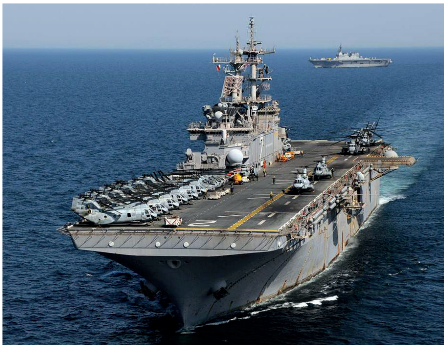
USS Essex (LHD 2) sejler ud for Japans nordøstlige kyst med JS Hyuga (DDH 181).

En potentiel krig mellem USA og Kina vil, hvis den finder sted, blot være det seneste eksempel på USA's militære aggres-