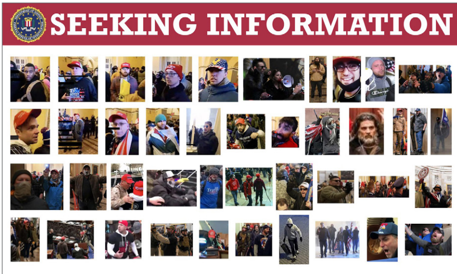
FBI-Plakat zur Suche nach Informationen über die Gewalt im US-Kapitol am 6. Januar 2021.

und begrüßte den Verweis der USA auf die Budapester Konvention und deren zweites Protokoll als ‚Goldstandard‘. In einer kurzen Präsentation von Eurojust wurde die laufende Zusammenarbeit im ANOM-Fall hervorgehoben, wobei ein ‚Sperrbereich für die Fallbearbeitung‘ eingerichtet wurde, der es Staatsanwälten ermöglicht, nicht-sensible Informationen über Fälle und Gerichtsentscheidungen auszutauschen.